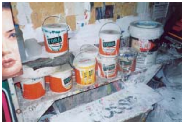
สีน้ำพลาสติก