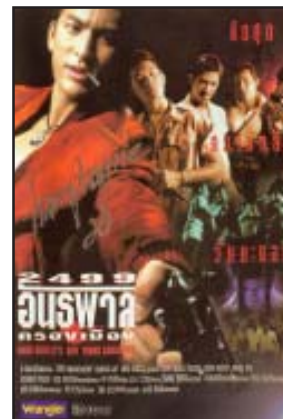
ใบปิดในยุคปัจจุบัน

สันนิษฐานว่าความเป็นมาของใบปิดหรือโปสเตอร์ โดยเฉพาะในประเทศไทยมาจากตะวันตกและอาจมีการพิมพ์ใบปิดมาตั้งแต่สมัยรัชกาลที่ 4 เพราะช่วงนั้นปรากฏหลักฐานการพิมพ์และการนำเครื่องพิมพ์ในระบบอุตสาหกรรมเข้ามาใช้ แต่ไม่พบหลักฐานใบปิดว่าเริ่มขึ้นเมื่อไร คงมีเพียงหลักฐานที่อ้างถึงการพิมพ์ใบปลิว และใบปลิวโฆษณาหนังและ