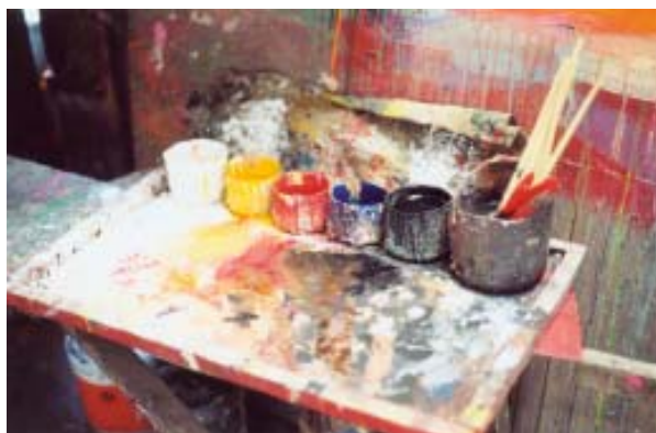
พู่กันแบนและอุปกรณ์ระบายสี