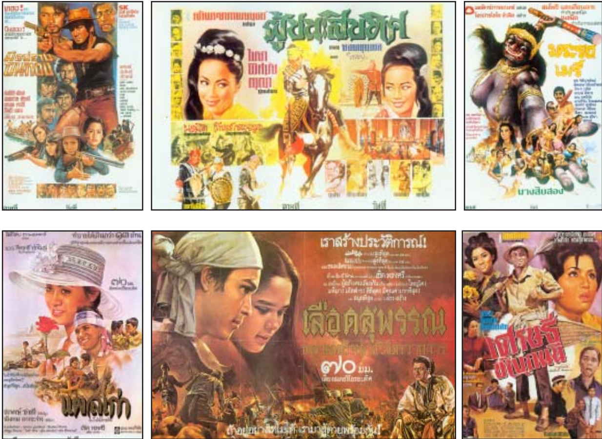
โปสเตอร์และป้ายโฆษณาขนาดใหญ่

พัฒนาการของโปสเตอร์หรือโปสเตอร์หนึ่งจากอดีต ซึ่งได้อาศัยทักษะและฝีมือของช่างเขียนโปสเตอร์กำลังหมดสิ้นไป ผู้เขียนเกรงว่าในอนาคตอันใกล้นี้ ช่างเขียนคัดเอาที่ขนาดใหญ่ก็จะสูญหาย