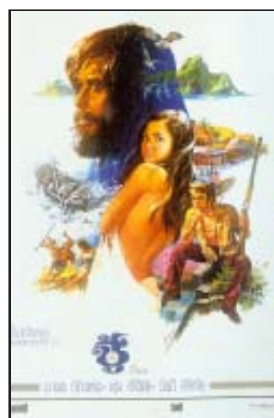
โปสเตอร์เรื่องชู