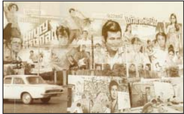
คัดเอาท์หน้าโรงหนังและริมถนน

เที่ยวได้ฉบับนี้ขอนำเที่ยวหลังโรงหนัง ซึ่งเป็นดินแดนหวงห้าม เพราะจะสังเกตเห็นป้ายก่อนเข้าหลังโรงหนังเขียนไว้ว่า “ไม่มีกิจห้ามเข้า” ผู้เขียนจึงขอเสนอความลึกลับหลังโรงหนังให้ทราบ ผู้คนที่เคยชินกับโรงหนังในอดีต คงจะคุ้นเคยกับคัดเอาท์ใหญ่ที่ตั้งโฆษณาหน้าโรงหนังโปรแกรมในปัจจุบัน คัดเอาท์ใหญ่ที่ติดตั้งอยู่หน้าโรงหนังเกิดจากฝีมือและทักษะในการวาดภาพระบายสีของช่างเขียนภาพโรงหนัง ซึ่งใช้หลังโรงหนังเป็นแหล่งผลิตภาพโฆษณาเช่นนี้ ที่กล่าวว่าเป็นเขตหวงห้าม เพราะช่างเขียนก็มีลักษณะนิสัยเช่นศิลปินทั่วไปที่รักความเงียบสงบ ไม่วุ่นวาย เพื่อความมีสมาธิในการสร้างสรรค์ผลงาน จึงไม่อนุญาตให้บุคคลที่ไม่มีกิจเข้าไปสร้างความรำคาญใจ ผู้เขียนจำได้ว่า ตัวเองมีความรักและชอบศิลปะจนชอบถึงทุกวันนี้ เพราะสนใจการวาดภาพ ระบายสีของช่างเขียนหลังโรงหนังนี้เอง ในวัยเด็กผู้เขียนจะไปยืนเกาะลูกกรงประตูทางเข้าหลังโรงหนัง เพื่อสังเกตดูการวาดภาพระบายสีของช่างเขียนทุกขั้นตอนตลอดทั้งวัน และแล้ววันที่ผู้เขียนดีใจที่สุดก็มาถึง คือ วันที่ช่างเขียนคนที่เราชื่นชอบ หันมามองเราและพูดว่า “ไ้บ่าว ช่วยไปซื้อโอเลี้ยงมาให้สักกระป๋อง” ตั้งแต่นั้น ผู้เขียนจึงมีโอกาสได้ไปนั่งใกล้ช่างเขียนคนนั้นโดยไม่ขัดเงิน