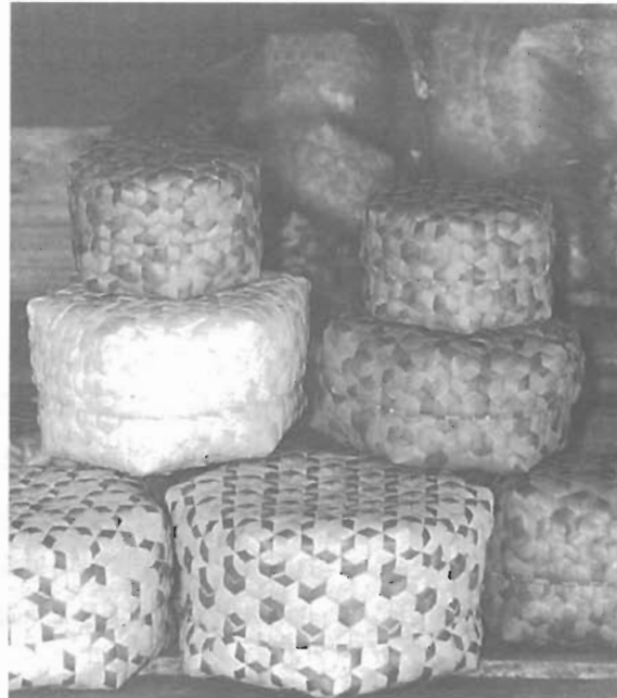
ผลงานของแม่ชี