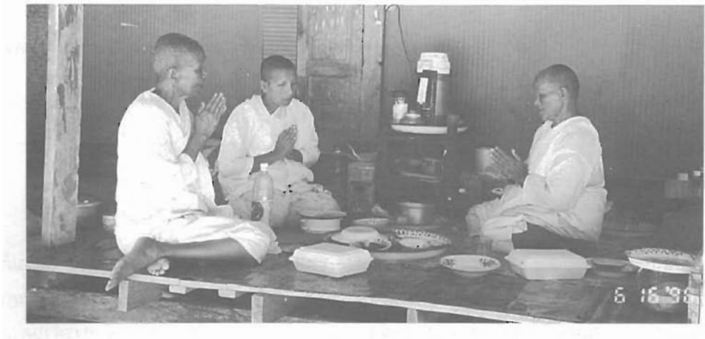
สัlagาวัดของแม่ชีวัดไชยศิริ