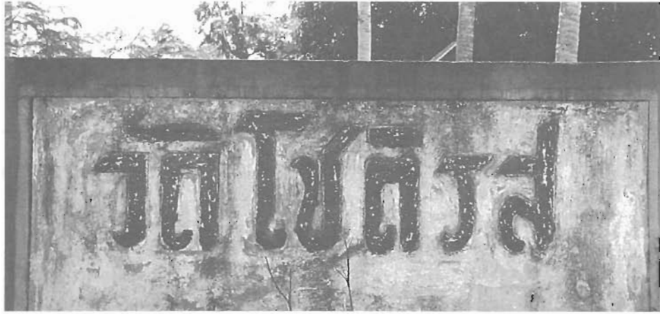
ป้ายหน้าวัดไชยศิริ