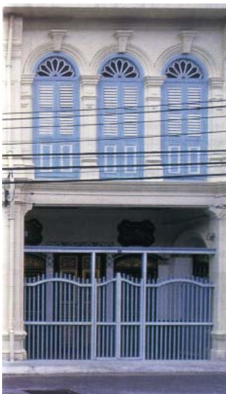
อาคารชิโน-ปอร์ตุเกส ยึดหลักความสมดุลตามหลักการ ของศิลปะเรอเนสซองส์

2.1 ศิลปะเรอเนสซองส์ (Renaissance) ซึ่งมีลักษณะเด่นในการสร้างสถาปัตยกรรมที่มีช่องโค้งมน (Round Arch) มีหินหลักยอดโค้ง (Keystone) และการจัดช่องหน้าต่างหรือประตูโค้งเป็นแถว การตกแต่งหัวเสา การตกแต่งหลังคาโดยกันเชิงเป็นราวแถวลูกกรง และจะคำนึงถึงหลักความสมดุล (Symmetry) และความกลมกลืนเป็นสำคัญ