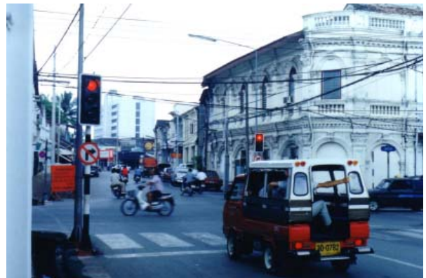
อาคารชิโน-ปอร์ตุเกสที่สี่แยกถนนเยาวราช