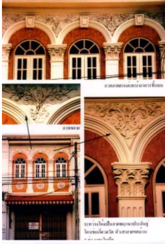
ลวดลายปูนปั้นตกแต่งหน้าอาคารชิโน-ปอร์ตุเกส

ลวดลายด้วยการปั้นสดด้วยมือ แต่ต่อมาเมื่อต้องการความรวดเร็วในการตกแต่ง จึงเปลี่ยนมาใช้วิธีการหล่อด้วยแม่พิมพ์ เมื่อได้ลวดลายตามต้องการแล้วจึงนำไปตกแต่งหน้าอาคารตามต้องการ