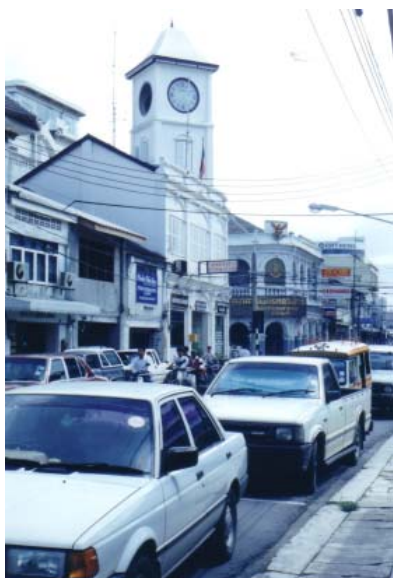
สถานีตำรวจศูนย์พรหมเทพ อิทธิพลชิโน-ปอร์ตุเกส