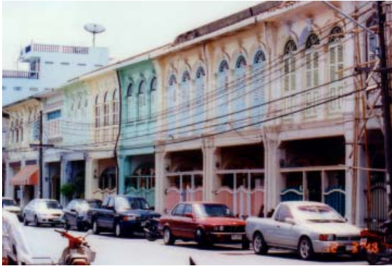
อาคารชิโน-ปอร์ตูกีสแบบตึกแถว

เที่ยวได้ฉบับนี้ขอเชิญชวนท่านให้มาเที่ยว จังหวัดภูเก็ต ดินแดนสวรรค์บนด้ามขวานทองของ ไทยที่มีคำขวัญประจำเมืองว่า “ไข่มุกอันดามัน สวรรค์ เมืองใต้ หาดทรายสีทอง สองวีรสตรี บารมีหลวงพ่อ แช่ม” แล้วอย่าลืมแวะเยี่ยมชมการตกแต่ง ลวดลายหน้าอาคารชิโน-ปอร์ตูกีสของเมืองภูเก็ต