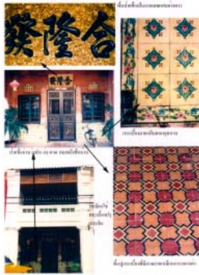
ลวดลายที่เป็นสัญลักษณ์ของความเป็นลัทธิมณฑล แบบจีน