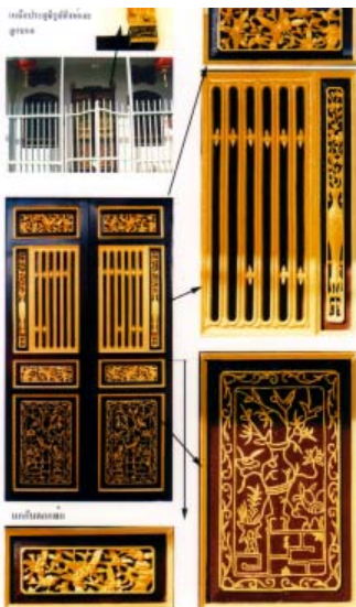
ลวดลายแกะสลักไม้ซึ่งเป็นลวดลายมงคล