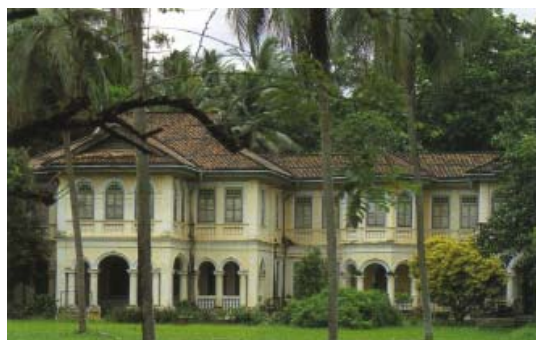
คฤหาสน์แบบชิโน-ปอร์ตุเกส

2. บ้านเดี่ยวแบบคฤหาสน์ เป็นอาคารที่บ่งบอกถึงฐานะของผู้อยู่อาศัย เช่น เป็นเจ้าเมือง เศรษฐี หรือคหบดีของจีน มีลักษณะเป็นหลังเดี่ยวขนาดใหญ่มีบริเวณและกำแพงล้อมรอบ