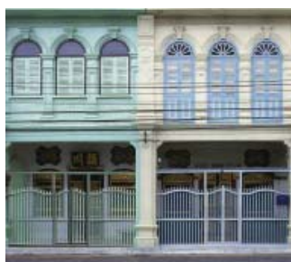
ห้องแถวชิโน-ปอร์ตุเกส

1. บ้านตึกแถว เป็นห้องแถวเรียงต่อกันเป็นห้องๆ ส่วนใหญ่เป็นทั้งที่พักอาศัย และทำธุรกิจด้วย โดยชั้นบนเป็นที่พักอาศัย ส่วนชั้นล่างเป็นที่ประกอบการค้าธุรกิจ