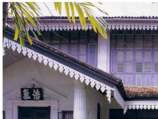
ลวดลายฉลุไม้ตกแต่งที่เชิงชายอาคารชิโน-ปอร์ตุเกส

2.3 ศิลปะวิกตอเรีย (Victoria Style) มีลักษณะเด่นในการตกแต่งลวดลายฉลุไม้ประดับอาคารที่เรียกว่า “ลายขนมปังขิง” ตามหน้าจั่ว เชนชายและลูกกรง