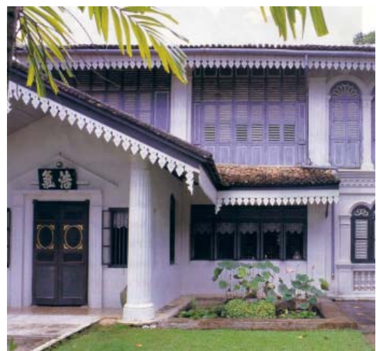
อาคารชิโน-ปอร์ตุเกสอายุเกือบร้อยปีในย่านการค้าภูเก็ต