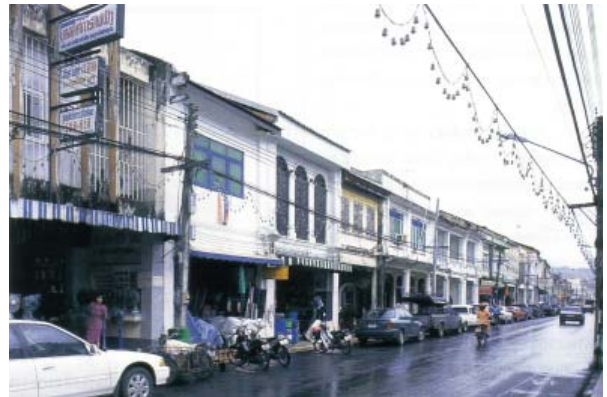
อาคารชิโน-ปอร์ตุเกสที่ถนนกลางเมืองภูเก็ต

เที่ยวจังหวัดภูเก็ตเที่ยวนี้ ถ้ามีเวลาว่างหลังจากออกไปอาบแดด สัมผัสกับสุนทรียะในธรรมชาติของดินแดนไข่มุกอันดามันแล้ว ลองกลับมาเดินเที่ยวในเมือง เที่ยวชมลวดลายตกแต่งหน้าอาคารชิโน-ปอร์ตุเกสตามริมถนนสายต่างๆ ดังนี้คือ ถนนภูเก็ต ถนนกลาง ถนนกระบี่ ถนนดีบุก ถนนเยาวราช ถนนพังงา ถนนรัชฎา ถนนระนอง และถนนบางกอก