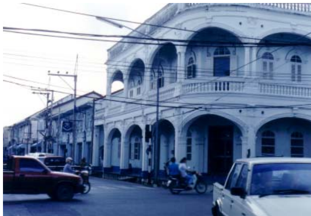
อาคาร “ชิโน-ปอร์ตุเกส” ที่ภูเก็ต

นอกจากความงามทางธรรมชาติของภูเก็ตแล้ว เที่ยวได้ฉบับนี้จะขอนำท่านชมและรู้จักกับผลงานศิลปวัฒนธรรมที่มีชื่อเสียงของอำเภอเมืองจังหวัดภูเก็ตนั่นคือ การตกแต่งลวดลายหน้าอาคารชิโน-ปอร์ตุเกส