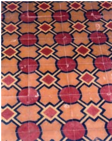
กระเบื้องลวดลายรูปทรงเรขาคณิต ที่ตกแต่ง อาคารชิโน-ปอร์ตุเกส

เที่ยวจังหวัดภูเก็ตเที่ยวนี้ ถ้ามีเวลาว่างหลังจากออกไปอาบแดด สัมผัสกับสุนทรียะในธรรมชาติของดินแดนไข่มุกอันดามันแล้ว ลองกลับมาเดินเที่ยวในเมือง เที่ยวชมลวดลายตกแต่งหน้าอาคารชิโน-ปอร์ตุเกสตามริมถนนสายต่างๆ ดังนี้คือ ถนนภูเก็ต ถนนกลาง ถนนกระบี่ ถนนดีบุก ถนนเยาวราช ถนนพังงา ถนนรัชฎา ถนนระนอง และถนนบางกอก