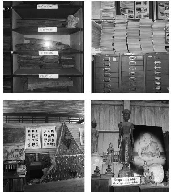
ภาพชุด 2 การจัดเก็บหนังสือบุต ทั้งบุตดำ บุตขาว และหนังสือเพลลา มีการจัดทำดัชนี รายการแบ่งแยกประเภทและหมวดหมู่

ภาพชุด 2 แสดงให้เห็นว่าข้อมูลของวรรณกรรม ลายลักษณ์ประเภทศาสนาที่มีมากที่สุด 6 ประกอบ ด้วยเอกสารตัวเขียนซึ่งใช้อักษรไทยหรืออักษรขอม จารลงในใบลาน แล้วบันทึกลงในหนังสือบุตซึ่งมี 2 ประเภท คือ บุตดำเป็นหนังสือที่บันทึกด้วย อักษรสีขาว สีเหลือง สีทอง ลงบนกระดาษสีดำ และ บุตขาวเป็นหนังสือที่บันทึกด้วยตัวอักษรสีดำ หรือสีน้ำตาลลงบนกระดาษสีขาว หนังสือบุตที่พบ มี 3 ขนาด คือ ขนาดสมุดธรรมดา ความยาวของ สมุดที่พับแล้วประมาณ 22*5 นิ้ว ขนาดสมุดพระมาลัย ความยาวของสมุดที่พับแล้ว 39*5 นิ้ว และขนาด กระดาษเพลลา คลื่นออกมาจะสั้นกว่า สำหรับหนังสือ เพลลาเป็นสมุดข่อยเย็บแบบฝรั่ง จารเฉพาะเรื่องราว ของวัด ตำนาน สถานที่ พระกับปนาวัต ผู้อ่าน หนังสือเพลลาตั้งอยู่ในศาล เป็นผู้บริสุทธิ์ นุ่งขาว ห่มขาว ตามความเชื่อบุคคลทั่วไปไม่สามารถนำ หนังสือเพลลามารับอ่านได้ ก่อนอ่านหนังสือเพลลาต้อง มีการจำลองรูปช้างเผือกขึ้นเพื่อให้ผู้อ่านนั่งอ่าน บนหลังช้างเผือก ในจังหวัดพัทลุงพบหนังสือเพลลา มากที่สุด ณ วัดเขียนบางแก้ว 7