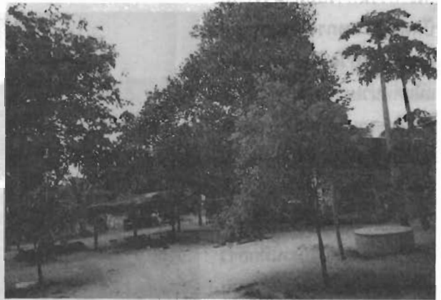
ลานด้านข้างของศูนย์ฯ เป็นโรงสังกะสีมีกะทะไว้หุงข้าว เบ็ดเคี้ยวปล่อยๆ ไว้เป็นอาหารยามขัดสน

การดำเนินงานของศูนย์ฯ บริหารงานในรูปของคณะกรรมการ โดยมีคุณแม่แย เป็น ประธานกรรมการ ในด้านการเงินนั้นเนื่องจากเป็นศูนย์ฯ ที่ตั้งขึ้นเพื่อช่วยเหลือเยาวชนที่กำพร้าและยากจน จึงมิได้เก็บเงินจากเด็ก ๆ ที่เข้ามาอยู่ เงินที่ได้ส่วนใหญ่เป็นเงินบริจาคจากองค์กรเอกชน และจากบุคคลที่ศรัทธาในการดำเนินงานของศูนย์ฯ ไม่ว่าจะเป็นสมาคมยุวมุสลิมแห่งประเทศไทย มูลนิธิสันติชน องค์การยูนิเซฟ