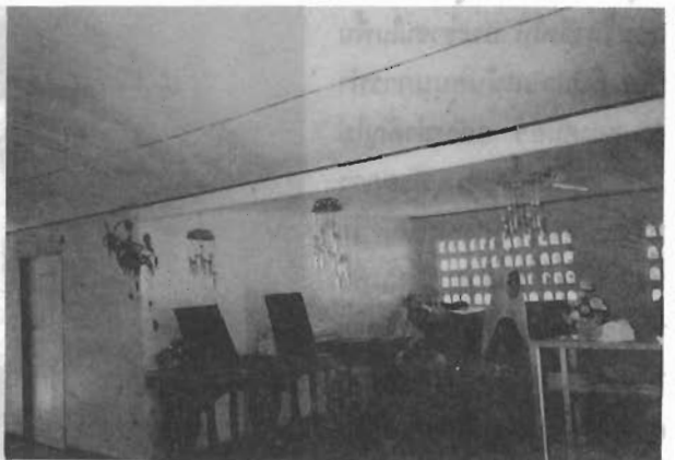
ห้องฝึกวิชาชีพ เสื่อผ้าในตู้เป็นชุด กุรง ของเด็กอนุบาล