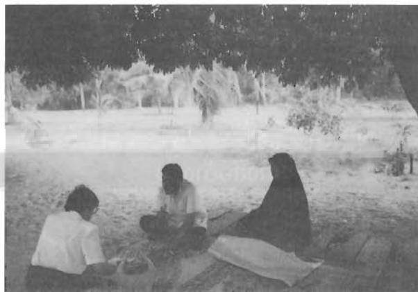
สองสามีภรรยาผู้เป็นกำลังสำคัญของศูนย์ฯ ขณะให้สัมภาษณ์

วัตถุประสงค์ทั่วไปของศูนย์ฯ นั้นมุ่งที่จะนำหลักการแห่ง ศาสนาอิสลามมาปฏิบัติในชีวิต และเพื่อแสวงหาความ โปรดปรานแห่งอัลลอฮ์ รวมทั้งเพื่ออบรมศาสนาขั้นพื้นฐานใน การดำรงชีวิต หลักการทางศาสนาเพียงอย่างเดียวคงไม่พอ ในชีวิตปัจจุบัน ดังนั้น ศูนย์ฯ จึงได้มุ่งอบรมวิชาชีพให้แก่เด็ก ๆ