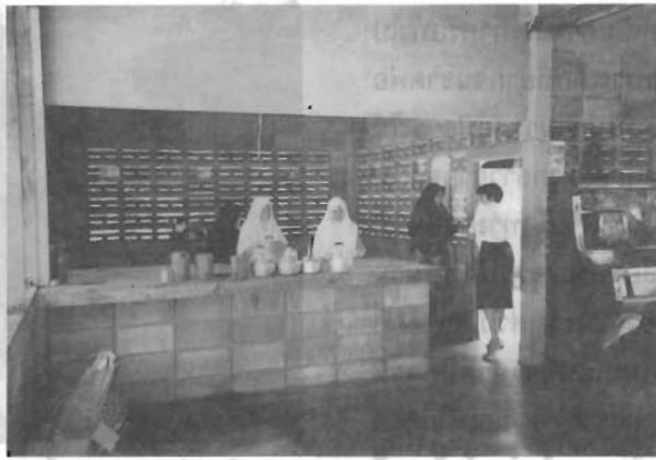
เตรียมน้ำและอาหารกลางวันสำหรับสมาชิกศูนย์ฯ

คณะกรรมการอิสลามจังหวัดปัตตานี สหกรณ์ออมทรัพย์อิสลามจังหวัดปัตตานี หรือแม้แต่หน่วยงานราชการอื่นเช่น ค่ายอิงคยุทธบริหาร กรมพัฒนาฝีมือแรงงาน สำนักส่งเสริมและการศึกษาต่อเนื่อง มหาวิทยาลัยสงขลานครินทร์วิทยาเขตปัตตานี หน่วยงานที่กล่าวมาทั้งหมดให้เป็นเงินสนับสนุนโครงการที่ศูนย์ฯ เสนอขอไป หรือในรูปของเงินบริจาค และในรูปของการส่งครูมาช่วยฝึกสอนวิชาชีพให้ ประชาชนในพื้นที่เองก็มีส่วนสนับสนุนการทำงานของศูนย์ฯ อย่างสำคัญไม่ยิ่งหย่อนไปกว่ากัน ด้วยการบริจาคอาหารไม่ว่าจะเป็น ไข่ ปลา น้ำตาล กัลฉ่าย น้ำมันพืช หรือแม้แต่บูดู ซึ่งเป็นอาหารประจำถิ่นที่นิยมบริโภคกันทุกครัวเรือน ขณะเดียวกัน เงินบริจาค ซากัดเป็นส่วนที่นำมาใช้ดำเนินงานในศูนย์ฯ ด้วย