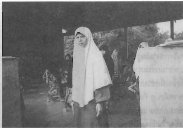
ส่วนหนึ่งของยูวสตรีในศูนย์ฯ แห่งนี้

ค่าใช้จ่ายที่ศูนย์ฯ ต้องแบกภาระ ประมาณเดือนละ 20,000 บาท ในจำนวนนี้รวมทั้งค่าจ้างครู 10 คน ซึ่งเป็นทั้งผู้สอนทางวิชาการศาสนา และสามัญ รวมทั้งเป็นที่เลี้ยงให้แก่ เด็ก ๆ ของศูนย์ฯ ด้วย ค่าอาหารที่ศูนย์ฯ คิดเฉลี่ยคนละ 15 บาท ต่อวัน