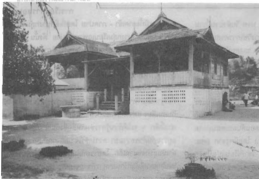
บ่ออังกูบหรืออังกาบ บาลาเซาะห์เก่า ซึ่งปัจจุบันเป็นที่ทำการศูนย์ฯ และบางส่วนใช้เป็นหอนอนของเยาวชนของศูนย์ฯ ด้านหลัง อาคารนี้มีอาคาร 2 ชั้น ครึ่งตึกครึ่งไม้ ชั้นบนเป็นหอนอน ชั้นล่างเป็นห้องพัสดุ และห้องฝึกวิชาชีพ