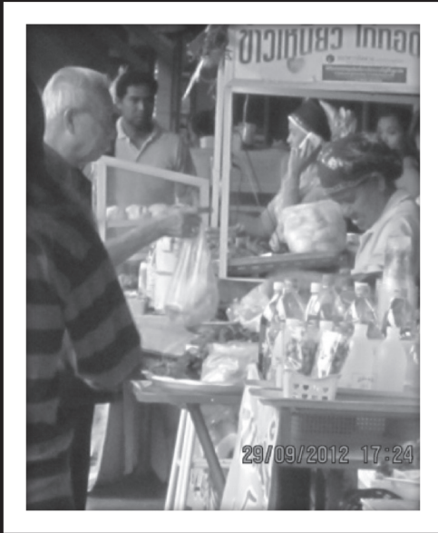
ป่านวลกำลังช่วยขายกับการขาย