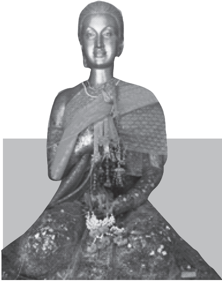
อนุสาวรีย์พระนางเลือดขาว ภายในวิหารวัดแม่เจ้าอยู่หัว อำเภอยะหริ่ง จังหวัดนครศรีธรรมราช

กรุงศรีอยุธยาปีละ 1 เชือก อันแสดงให้เห็นว่าเป็นช่วงที่กรุงศรีอยุธยาแผ่อำนาจลงมายึดครองเมืองนครศรีธรรมราชและเมืองพัทลุงให้ขึ้นตรงกับอยุธยา ต่อมากุมารกับนางเลือดขาวได้นำสมัครพรรคพวกอพยพไปตั้งบ้านเรือนใหม่ที่ “บ้านบางแก้วใต้” ตั้งแต่นั้นมาเรียกกุมารว่า “เจ้าพระยา” อันเป็นการแสดงให้เห็นถึงฐานะของกุมารว่าได้เป็นเจ้าเมืองพัทลุงที่บ้านบางแก้วใต้ใกล้กับวัดเขียนบางแก้ว นางเลือดขาวได้นำทรัพย์สินสมบัติมาตกแต่งพระวิหารและพระพุทธรูปไว้ที่วัดสทัง ฝ่ายเจ้าพระยากุมารได้นำทรัพย์สินนั้นมาสร้างวิหารและพระพุทธรูปวัดเขียนบางแก้ว แล้วนำทองมาตีแม่เป็นแผ่นเขียนเป็นตำนานให้ชื่อว่า “วัดเขียนบางแก้ว”