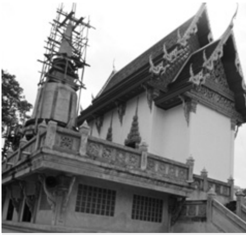
อุโบสถวัดพระเกิด ตำบลผาละมี อำเภอบางปะอิน จังหวัดพิจิตร