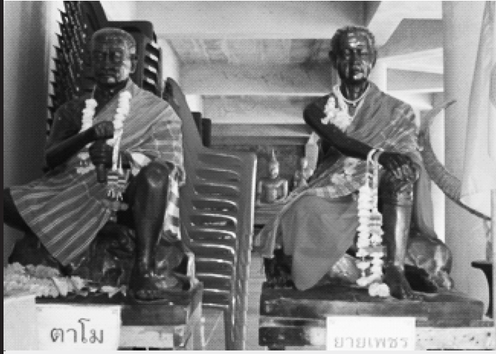
รูปปั้นดาสามโม ยายเพชร บิดาและมารดาบุญธรรมของ นางเลือดขาว วัดพระเกิด ตำบลผาละมี อำเภอบางปะอิน จังหวัดพิจิตร