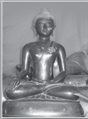
พระพุทธรูปหล่อ วัดหัวถนน ตำบลนาพระ อำเภอนาโยง จังหวัดตรัง ได้สูญหายไปจากวัดตั้งแต่ พ.ศ.๒๕๒๖