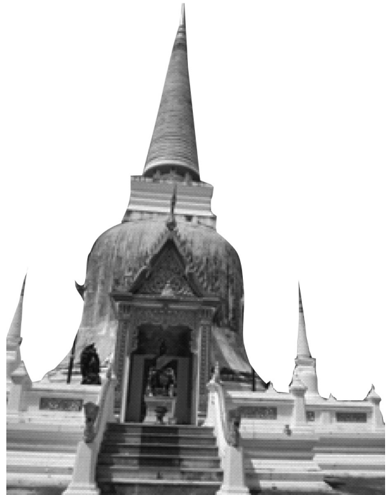
อนุสาวรีย์พระเจ้าศรีธรรมโศกราช วัดแม่เจ้าอยู่หัว อำเภอเชียรใหญ่ จังหวัดนครศรีธรรมราช

ตำนานนางเลือดขาวสำนวนต่างๆ ที่พบในภาคใต้ส่วนใหญ่สะท้อนให้เห็นพลังศรัทธาในพระพุทธศาสนาและบทบาทของสตรีกับการผูกโยงเรื่องราวเพื่ออธิบายถึงชื่อบ้านนามเมืองบนคาบสมุทรไทย