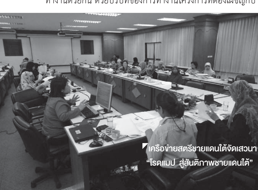
▶ เครือข่ายสตรีชายแดนใต้จัดเสวนา “โรดแมป สู่สันติภาพชายแดนใต้”

จุดเด่นของเครือข่ายสตรีชายแดนใต้ก็คือ ประเด็นนี้ถือได้ว่าเป็น “งานใหม่” ในประชาสังคมจังหวัดชายแดนภาคใต้ โดยเฉพาะในสังคมมลายูมุสลิม กล่าวได้ว่าการก่อเกิดงานด้านผู้หญิงเป็นผลมาจากสถานการณ์ที่บทบาทของผู้ชายถูกลดทอนหรือหายไป โดยจะสังเกตได้ว่า ประเด็นด้านสตรีและครอบครัวได้รับการยอมรับอย่างมาก โดยเฉพาะในกลุ่มครอบครัว ญาติ เหยื่อ ที่ได้รับผลกระทบจากความรุนแรง จึงทำให้บทบาทของผู้หญิงโดดเด่นมากขึ้นเรื่อยๆ ในภาคประชาสังคมชายแดนใต้ การสนับสนุนงานเครือข่ายผู้หญิง นับว่าเป็นการเพิ่มพื้นที่การทำงานด้านสังคมของผู้หญิงให้กว้างมากยิ่งขึ้น อีกทั้งยังเชื่อมร้อยคนทำงานด้วยกัน ด้วยบริบทของการทำงานโครงการที่ต้องเผชิญกับ