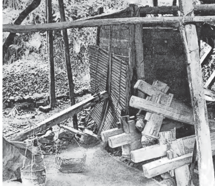
▶ โรงตำแร่ทองชาวจีนที่โต๊ะโมะในช่วงกลางทศวรรษ 1890

น่าเสียดายว่าบันทึกของชาวต่างประเทศไม่ได้บอกถึงเรื่องของวิถีชีวิตในด้านอื่นๆ นอกจากทำทองของชาวโต๊ะโมะ แต่ดูเหมือนว่าพื้นที่ดังกล่าว จาก