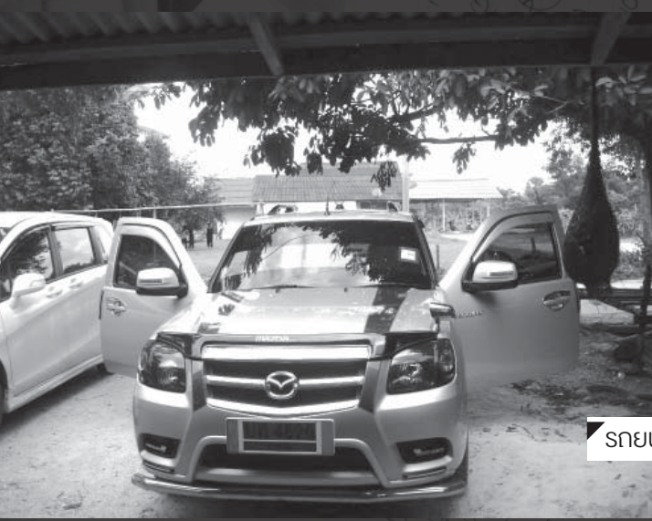
รถยนต์คู่ยากใช้ตระเวนรับงานและขึ้นเวทีแสดง

“ เวลาคนซื้อแผ่นไป หากในแผ่นนั้นมีแต่เพลงของเราคนเดียวคนฟังเขาจะเบื่อ จึงต้องรวมของ นักร้องหลายคนด้วย ซึ่งในอัลบั้มของผมหนึ่งชุดจะมีอยู่ 4 แนวเพลง ตลก ความรักและอกหัก ชีวิตและความเป็นอยู่ของคนทั่วไป การเซดซูพันธ์ที่ พันถิ่นที่เราอยู่ ”