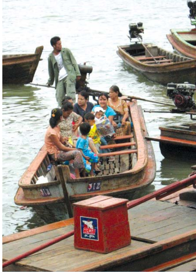
ชาวพม่าข้ามไปมาระหว่างเกาะสอง-ระนอง ทั้งค้าขายและลักลอบเข้าเมือง

บริเวณที่อยู่อาศัยของชาวพม่าในปัจจุบัน ถูก แบ่งแยกจากชุมชนไทย แหล่ง “ชุมชนพม่า” ปัจจุบัน กับ “ตลาดพม่า” ในอดีต ความหมาย