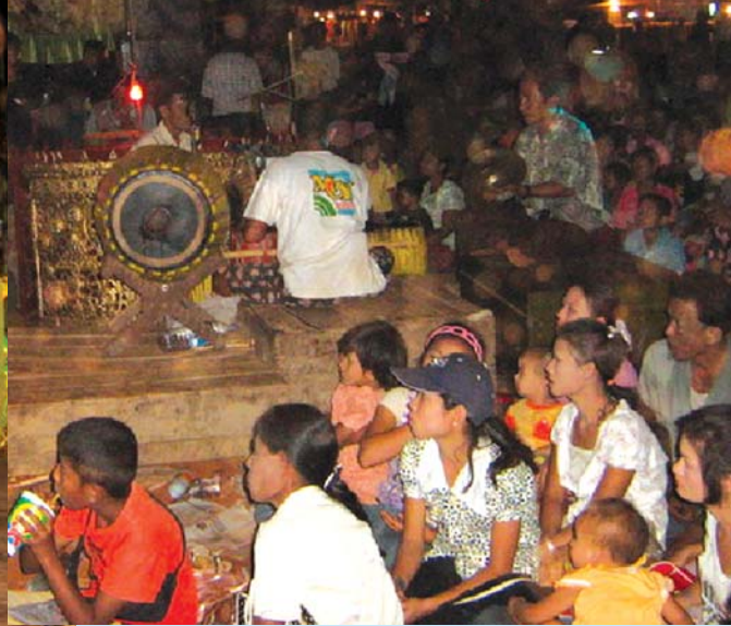
โอกาสที่แรงงานข้ามชาติจะหาตุลิกะพม่าได้ต้องเป็นงานบุญประจำปีที่ทองผาภูมิ

พุทธศาสนิกชนเหมือนกัน แต่แยกกันทำบุญคนละฟาก ผิดกับคนไทยหลายคนที่ได้มีโอกาสได้ไปทำบุญที่วัดในฝั่งเกาะสอง หลวงพ่อเจ้าอาวาส พระลูกวัดรวมทั้งชาวบ้านให้เกียรติ เป็นมิตรกับคณะคนไทยอย่างมาก การแสดงออกในการต้อนรับอย่างเป็นเกียรติ คณะคนไทยทำบุญอยู่แถวหน้า ร่วมถ่ายภาพกับเจ้าอาวาส ในขณะที่พื้นที่เกาะสองและระนองก็เป็นพื้นที่พรมแดนไทยพม่า ในด้านภูมิศาสตร์เหมือนกัน