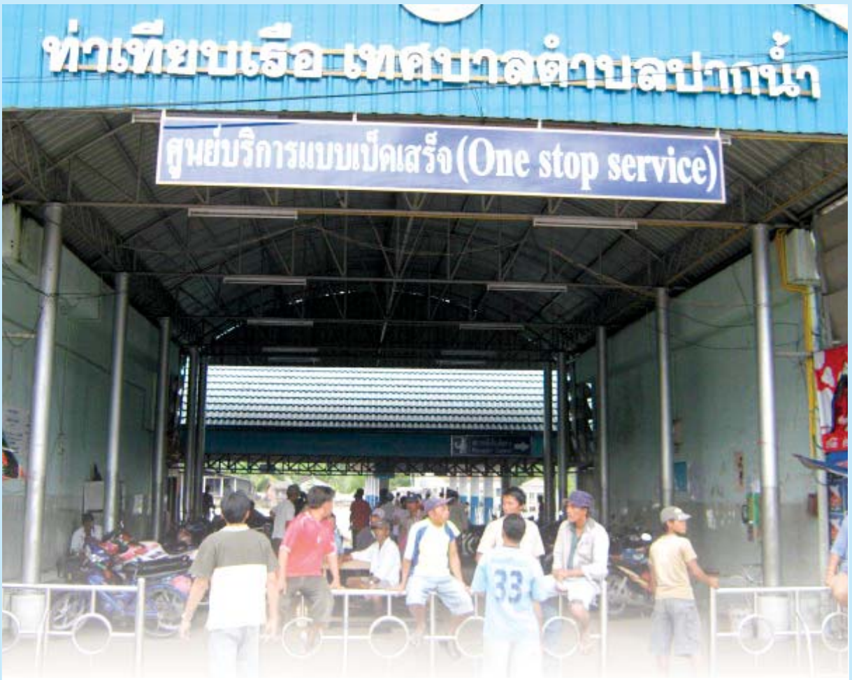
ท่าเรือข้ามฟากระหว่างเกาะสอง-ระนอง

แตกต่างกันอย่างสิ้นเชิง ชุมชนพม่าเป็นความท้าทายในแง่สถานะการเป็นแรงงานต่างด้าว ที่อยู่ในบริบทของประเทศไทยในปัจจุบันในแนวคิด assimilate ความเป็นไทยโดยวัฒนธรรมและภาษา ประกอบกับแนวคิด nationalism คุณเป็นคนไทยหรือเปล่า? คนที่แตกต่างไปจากความเป็นไทยก็กลายเป็นอื่น ชุมชนพม่าในเมืองระนองก็กลายเป็นเส้นแบ่งพรมแดนกันระหว่างไทยและพม่า เคลื่อนย้ายไปพร้อมกับพม่าในทุกหนแห่ง เป็นพื้นที่ทางการเมืองที่ถูกกำหนดโดยรัฐไทย แรงงานพม่าเกือบทั้งหมดไม่มีพาสปอร์ต เพราะค่าธรรมเนียมที่ค่อนข้างแพง แรงงานพม่าจึงยากที่จะมีเสรีภาพในการเดินทางออกนอกอาณาเขตที่กำหนดไว้คือ ไม่เกิน 16 กิโลเมตรจากบริเวณที่อยู่อาศัย ออกไปไกลกว่านั้นถือว่าลักลอบและผิดกฎหมาย หากจะมีการเคลื่อนย้ายแรงงานออกนอกพื้นที่ที่กำหนดหรือออกนอกเขตจังหวัด คนที่อนุมัติได้เพียงคนเดียวคือผู้ว่าราชการจังหวัดเท่านั้น ถือว่าอยู่ภายใต้อำนาจสูงสุดของจังหวัด ฉะนั้นการเดินทางออกนอกอาณาเขตของแรงงานพม่าจึงพกคดีลักลอบเข้าเมืองติดตัวไปด้วยตลอดเวลา เคราะห์หามยามร้ายถูกจับได้ก็就会被ส่งกลับพม่าทันที