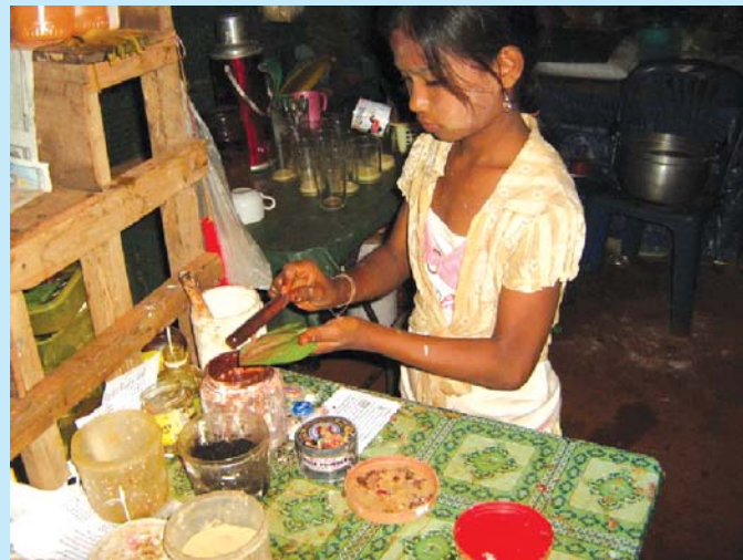
หมากพลู วัฒนธรรมการกินหมากของพม่ามีความสำคัญที่ต้องมีในทุกยามแม้แต่ในคืนมรสุม

จังหวัดระนอง ซึ่งเป็นพื้นที่บนพรมแดนไทย-พม่าทางภาคใต้ตอนบนของไทย จังหวัดระนองมีเนื้อที่ประมาณ 3,298.045 ตารางกิโลเมตร เป็นจังหวัดที่มีพื้นที่มากเป็นอันดับที่ 60 ของประเทศไทย เป็นพื้นที่ราบ 14% และภูเขา 86% มีเกาะน้อยใหญ่ในทะเลอันดามันจำนวน 62 เกาะด้านทิศตะวันตกติดกับทะเลอันดามัน และประเทศพม่า 1 ทิศเหนือติดจังหวัดชุมพร ทิศตะวันออกติดกับจังหวัดสุราษฎร์ธานี ทิศใต้ติดกับจังหวัดพังงา คนพม่าในจังหวัดระนองมีหลายระดับชนชั้น และ