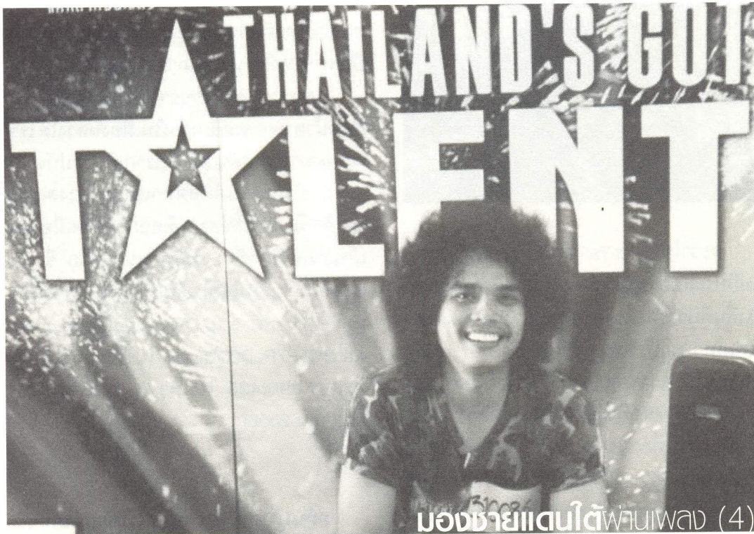
บองชายแดนใต้พาวเนล (4)