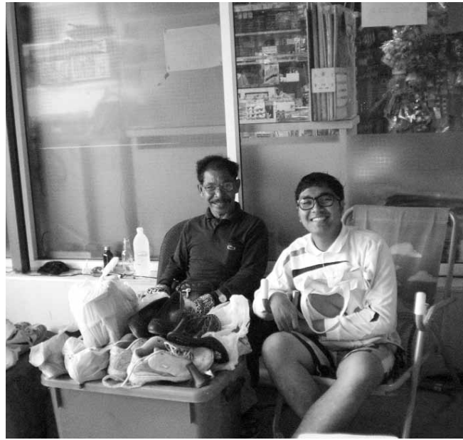
▲ ผู้เขียนกับลุงน้อยและร้านซ่อมรองเท้า

“ถ้าจะถามลุงเรื่องการปรับตัวเพื่ออยู่ให้ได้ในสภาพเศรษฐกิจแบบนี้และสถานการณ์สามจังหวัด ลุงคงพูดอะไรได้ไม่มาก ไม่ใช่ไม่อยากพูด แต่ลุงว่ายิ่งพูดก็จะยิ่งเพิ่มปัญหาให้สังคมมากขึ้น ลุงหมายความว่า ชาวบ้านขาดการศึกษาที่เขาเข้ากินค่าอย่างลุงจะไปเอาอะไรมาพูดว่าเหตุการณ์มันเกิดขึ้นได้ยังไง จะจบเมื่อไร