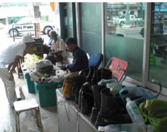
▲ ลูกค้ากับลุงน้อยกำลังดูจุดที่รองเท้าเสีย