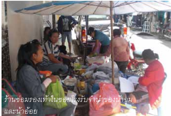
ร้านซ่อมรองเท้าในซอยโรงรับจำนำของน้ำจุมและน้ำอ้อย