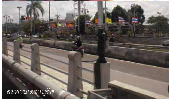
สะพานเดชานุชิต

ลุงพยายามหาทางรักษาในกรุงเทพฯ อยู่สองสามปี เห็นไม่เป็นผลก็เลยพาป้าสำราญไปรักษาตัวที่บ้านพี่สาว” ที่อำเภอกวนกาหลง จังหวัดสตูล “รักษาทั้งหมดบ้านและหมอโรงพยาบาล” รักษาอยู่ได้ไม่นานป้าสำราญก็เสียชีวิต ลุงน้อยเลยจัดงานศพป้าสำราญที่วัดควนกาหลงบ้านพี่สาวของป้าสำราญนั่นเอง