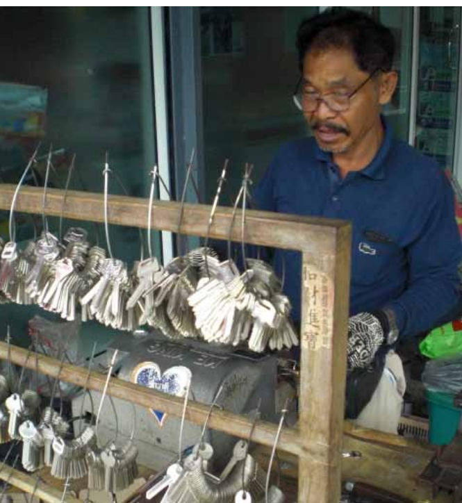
▲ ลุงน้อยกับร้านทำกุญแจที่ร่วมลงทุนกับเพื่อน