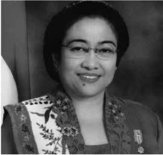
▲ เมกาวาตี ซูการ์โนบุตรวี