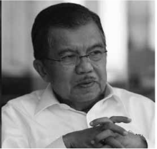
▲ ยูซุฟ คาลลา