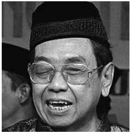
อับดุลเราะห์มาน วาฮิด

การเข้าดำรงตำแหน่งประธานาธิบดีของยูทโธโยโนอยู่ภายใต้การคาดหวังจากประชาชนเป็นอย่างมาก โดยเฉพาะต่อการสร้างเสถียรภาพทางสังคมพัฒนาเศรษฐกิจ แต่กลับกลายเป็นว่าในช่วงแรกของการดำรงตำแหน่ง เขากลับไม่ค่อยได้รับการยอมรับจากประชาชนมากนัก อย่างไรก็ตาม เมื่อรัฐบาลเริ่มดำเนินการบริหารได้อย่างเข้มแข็ง ทำให้การเมืองมีเสถียรภาพ ก็สามารถทำการฟื้นฟูเศรษฐกิจของประเทศได้อย่างเป็นรูปธรรม ควบคุมปัญหาความรุนแรงที่เกิดขึ้นใน