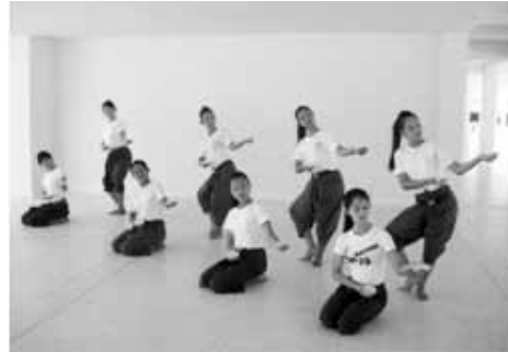
การตั้งข้อมูมออกแบบจากการใช้มือชิละ