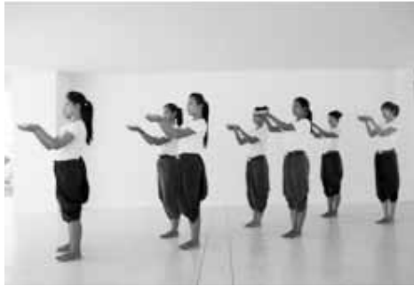
ทำออกแบบจากการเดินขบวน