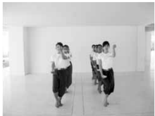
ท่าโชว์เทียน (ตาริเล็ง)