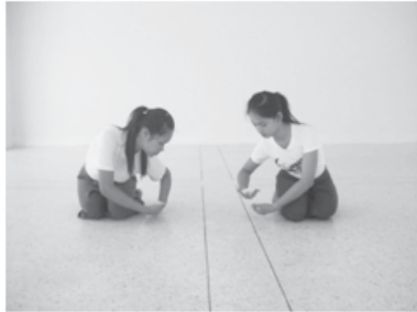
ทำนั่งรักษาโรค

ช่วงที่ 2 การออกแบบท่ารำในชวงนี้ สื่อถึงการรักษาโรคที่อยู่ในพิธีกรรมโดยใช้เปลวไฟรักษาโรคตามอวัยวะส่วนต่าง ๆ ของร่างกาย เพื่อให้เปลวไฟเผาไหม้สิ่งชั่วร้ายให้หมดไป