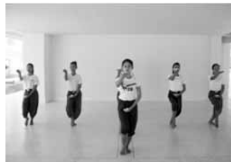
ทำไหว้สี่ทิศ