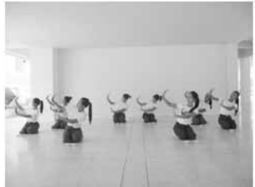
ท่ารำมือเปล่า (ตาริเล็ง)