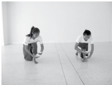
ทำนั่งชันเข่ารักษาโรค