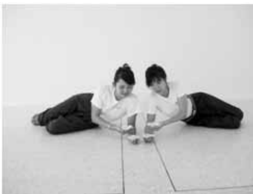
ท่านอน (ตาริเล็ง)