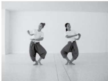
ทำยืนรักษาโรค