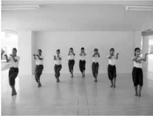
ท่าอวยพร 1

ช่วงที่ 3 การออกแบบท่ารำในขณะนี้ สื่อถึงการอำนวยความสะดวกให้ผู้รักษาโรคมีสุขภาพที่ดี สมบูรณ์แข็งแรง มีความรุ่งเรือง รุ่งโรจน์ เปรียบดังแสงเทียนที่สว่างไสว โชติช่วงชัชวาล