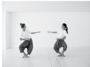
ทำนั่งหลังการรักษา