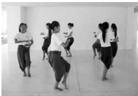
ทำร้ายมนตร์