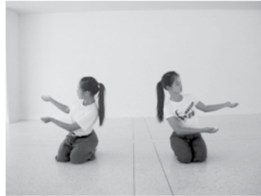
ทำนั่งหลังรักษา