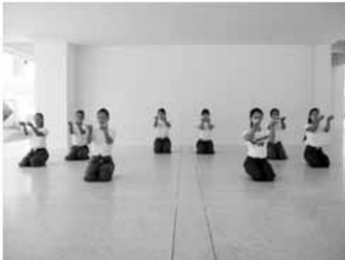
ท่าไหว้ (ตาริเล็ง)

การแสดงระบำพื้นบ้านไทยมุสลิมภาคใต้ ปรากฏว่า การแสดงพื้นบ้านไทยมุสลิมภาคใต้ เป็นการแสดงที่ศิลปินพื้นบ้านรองเง็งพัฒนา ปรับปรุง และสร้างสรรค์ มาจากการแสดง รองเง็ง ลักษณะของการแสดงยังคงยึดรูปแบบ ดั้งเดิมของการแสดงรองเง็งบางส่วนเอาไว้ เช่น ใช้เพลงพื้นบ้านรองเง็งประกอบการแสดง แต่งกายด้วยชุดพื้นเมืองไทยมุสลิม หากใช้นัก แสดงชาย-หญิงลักษณะการแสดงยังคงสื่อ