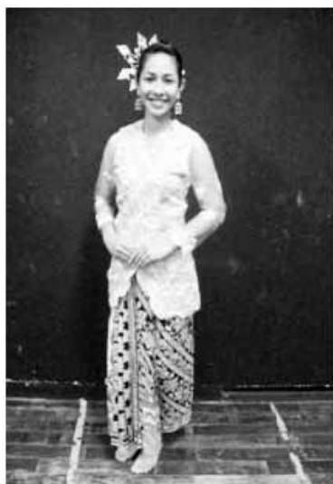
การแต่งกาย

จากนั้นออกแบบเครื่องแต่งกาย ผู้สร้างสรรค์คำนึงถึงจารีตการแต่งกายของชาวไทยมุสลิมภาคใต้เป็นหลัก เสื้อผ้าจะต้องปกปิดมิดชิด จึงออกแบบเสื้อผ้าเป็นชุดบานาง ตัดเย็บด้วยผ้าลูกไม้ นุ่งผ้าปาเต๊ะ เครื่องประดับใช้ดอกไม้ ปิ่นชมเป้ง ดอกลิลาวดี ต่างหู สร้อยคอ ดังรูป