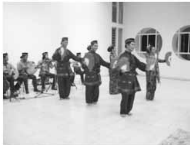
ตารีกีปัส

ประมาณ พ.ศ.2521 การแสดงระบำพื้น บ้านไทยมุสลิมภาคใต้ แพร่กระจายสู่สถานการ ศึกษาระดับประถมศึกษา และมัธยมศึกษาใน จังหวัดปัตตานี เนื่องจากศิลปินพื้นบ้านรองเง็ง ส่วนใหญ่รับราชการครู จึงสร้างสรรค์การแสดง