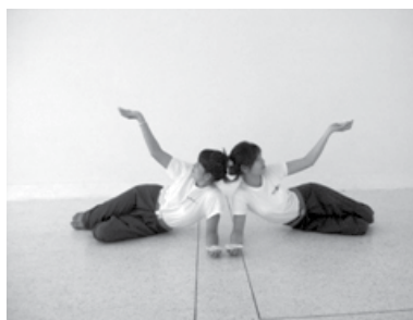
ทำนั่งหลังการรักษา