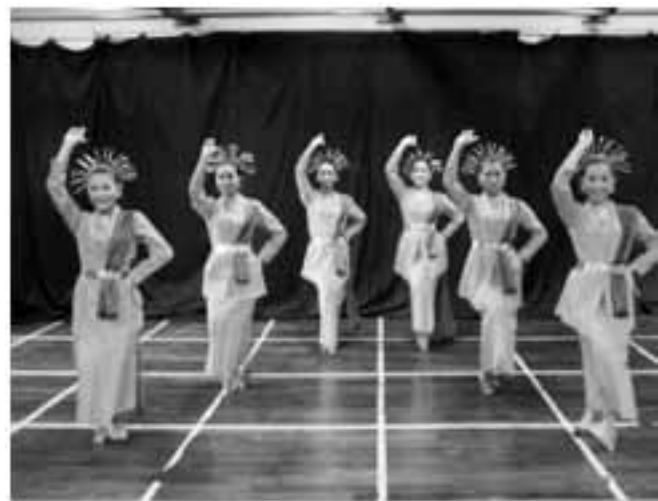
ระบำแกแฉะอูแด