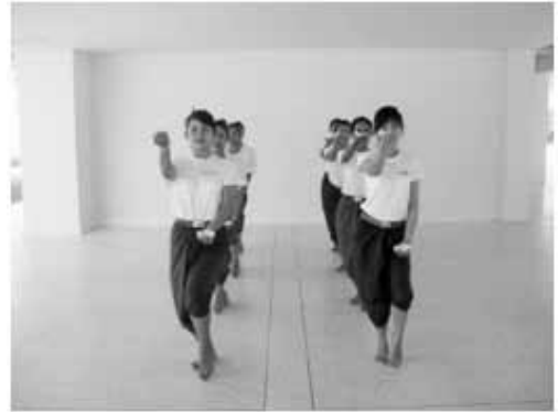
ท่าอวยพร 2

จากนั้นออกแบบเครื่องแต่งกาย ผู้สร้างสรรค์คำนึงถึงจารีตการแต่งกายของชาวไทยมุสลิมภาคใต้เป็นหลัก เสื้อผ้าจะต้องปกปิดมิดชิด จึงออกแบบเสื้อผ้าเป็นชุดบานาง ตัดเย็บด้วยผ้าลูกไม้ นุ่งผ้าปาเต๊ะ เครื่องประดับใช้ดอกไม้ ปิ่นชมเป้ง ดอกลิลาวดี ต่างหู สร้อยคอ ดังรูป