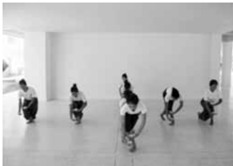
ทำไหว้สี่ทิศ