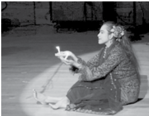
ตารีเตียน