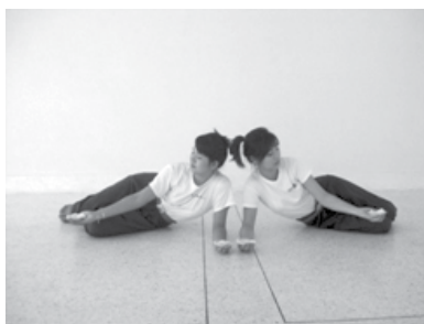
ทำนอนรักษาโรค