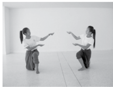
ทำนั่งหลังการรักษา