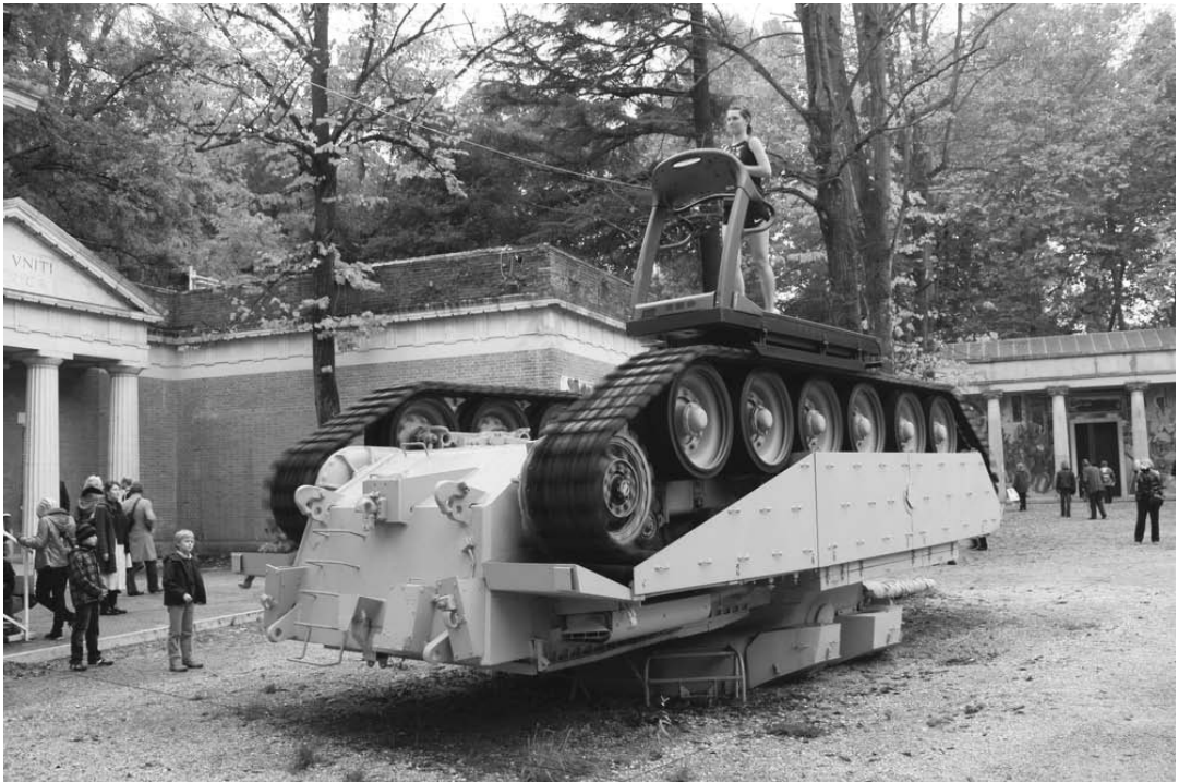
ผลงานของ Jennifer Allora และ Guillermo Calzadilla ศิลปินชาวอเมริกัน

ในช่วงที่ผ่านมา ผมได้มีโอกาสได้ไปชมนิทรรศการศิลปะนานาชาติ เวนิส เบียนนาเล่ (La Beinnale di Venezia) โดยการสนับสนุนจากกองทุนชุมพล พรประภา โดยมีคณาจารย์และนักศึกษาจาก 4 มหาวิทยาลัย รวมจำนวน 16 คน เข้าร่วมโครงการในครั้งนี้ด้วย