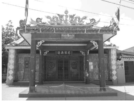
หิ้งพระเล่าเอี้ยะกงภายในบ้าน ศาลเจ้าที่ฮู้ฮ้องเอี้ยะ (ศาลเจ้าบางตะโล๊ะ)

เพื่อเป็นบริวารของเทพเจ้าเล่าเอี้ยะกง ได้แก่ องค์ปุ่นแตงก, องค์มาจ้อโป และองค์ฮู้จ้อ (เจ้าแม่กวนอิม) แล้วก็ทำพิธีอัญเชิญดวงวิญญาณเทพเจ้าสิงสถิตสู่องค์พระ ก่อนที่จะนำไปประดิษฐานในศาลเจ้า ต่อมา มีคนพบองค์พระอยู่ใต้ต้นหว้า มีลักษณะเป็นหลวงจีน มือซ้ายจับกระบี่ ขลุสองนิ้วเหยียดลงเสมอดัก มีนามว่าองค์ฟูชายกง ชาวบ้านเรียกพระลูกหว้า จึงได้อัญเชิญท่านมาประดิษฐานไว้ในศาลเจ้าด้วย ภายในศาลเจ้าจึงมีองค์พระประดิษฐานทั้งหมด 5 องค์ แต่ปัจจุบันในศาลเจ้าเล่าเอี้ยะกงมีองค์พระประดิษฐานเพิ่มจากเดิม ได้แก่ องค์ยี่เล่าเอี้ยะ, องค์ซาเล่าเอี้ยะ (ทั้งสองเป็นพี่น้องขององค์พระเล่าเอี้ยะกง), องค์ตี้ฮู้ฮ้อง, เจ้าพ่อเสื่อ, เจ้าแม่กวนอิมสามหน้า และเจ้าแม่ทับทิม ดังนั้นปัจจุบันจึงมีองค์พระที่ประดิษฐานในศาลเจ้า 11 องค์