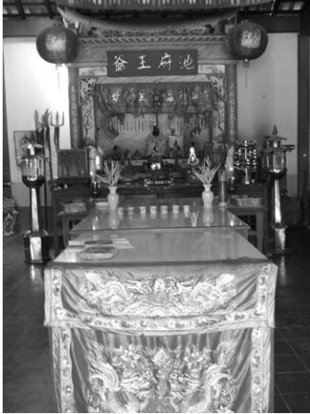
ภายในศาลเจ้าเล่าเอี้ยะกง