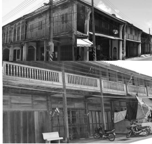
สถาปัตยกรรมบ้านเรือนจีนในสายบุรี