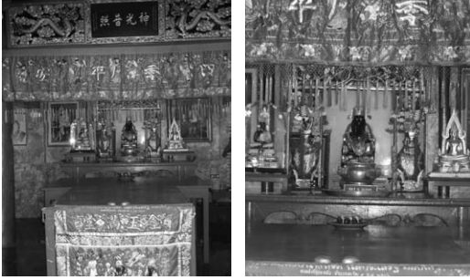
ภายในศาลเจ้าที่ฮู้ฮ้องเอี้ยะ องค์พระที่ฮู้ฮ้องเอี้ยะ

สาขาสายบุรี นอกจากนี้กระถางรูปทองเหลืองที่ ใช้อยู่ในศาลเจ้าปรากฏพระปรมาภิไธย จปร. อยู่ บนพื้นผิวของกระถาง ซึ่งได้รับการบอกเล่าว่า เป็นกระถางรูปที่พระบาทสมเด็จพระจุลจอมเกล้า เจ้าอยู่หัว (รัชกาลที่ 5) ทรงพระราชทานให้เมื่อ ครั้งเสด็จประพาสเมืองสายบุรี