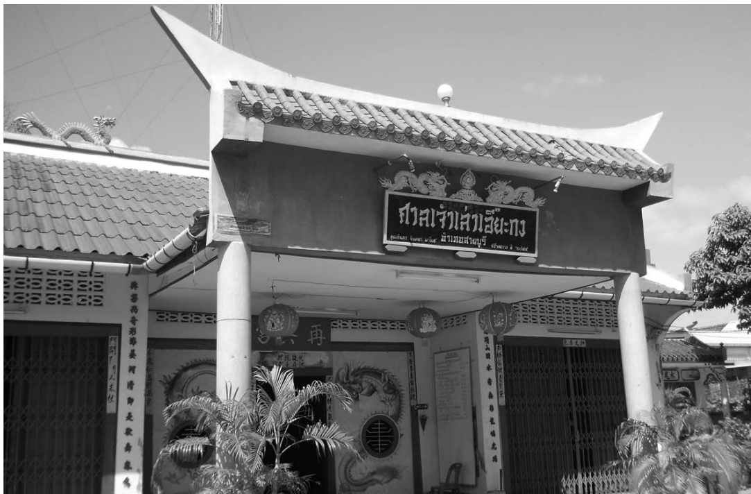
ศาลเจ้าเล่าเอี้ยะกง

วัดจีนหรือศาลเจ้าเป็นเทวสถานอันศักดิ์สิทธิ์ที่อยู่คู่กับชาวไทยเชื้อสายจีนมาช้านาน นับตั้งแต่ชาวจีนอพยพเข้ามาตั้งถิ่นฐานในประเทศไทย เป็นสถานที่ประกอบพิธีกรรมทางศาสนา เป็นที่จัดงานเฉลิมฉลองในเทศกาลต่างๆ รวมถึงเป็นที่จัดกิจกรรมสาธารณประโยชน์ “ศาลเจ้าเล่าเอี้ยะกง” เป็นเทวสถานหนึ่งอันเป็นที่พึงพอใจของชาวจีนสายบุรีที่อพยพเข้ามาตั้งถิ่นฐาน แล้วนำประเพณี พิธีกรรม ความเชื่อ ความศรัทธาในความศักดิ์สิทธิ์ขององค์เทพเจ้าเข้ามาด้วย