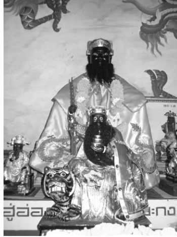
องค์พระเล่าเอี้ยะกง