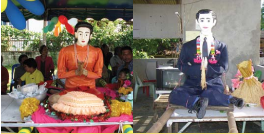
ตกแต่งหุ่นโตะชุมพุกด้วยเสื้อผ้าอาภรณ์เครื่องประดับตามสมัยนิยม เจ้าป่าวต้องหล่อ เจ้าสาวต้องสวยและมีฐานะทางสังคม เช่น ทหาร ตำรวจ พยาบาล ครู เป็นต้น (ภาพถ่าย 2 มิถุนายน 2551)

ให้ปราศจากภัยธรรมชาติ ศัตรูที่มาทำร้ายให้แปลงนาข้าวเสียหายได้ นัยยะทางสังคม คือการสร้างอัตลักษณ์ความเข้มแข็งในการอยู่ร่วมกัน สร้างเสริมสามัคคีระหว่างกลุ่มชน