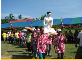
บรรยากาศขบวนแห่หุ่น “โตะชุมพุก” จากลานกว้างบ้าน บ่อโคกไปยังสถานที่จัดงานหน้า วัดควนใน (ภาพถ่าย 11 พฤษภาคม 2552)