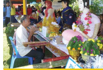
หมอขวัญได้ทำพิธีทำขวัญ หุ่นโตะชุมพุกคู่บ่าวสาวเพื่อความ เป็นสิริมงคล (ภาพถ่าย 11 พฤษภาคม 2552)

จัดอย่างสวยงามเพื่อเข้าร่วมขบวนแห่ “ขันหมาก มีจำนวนเป็นคี่ คือ 9 ขัน 15 ขัน 21 ขัน และ 25 ขัน และการจัดขันหมากจะไม่ทำในช่วงเช้า ต้องให้เวลา เลยเที่ยง ไปก่อน เรียกว่า “ตะวันคล้อยลง” ในอดีต ต้องให้ดวงอาทิตย์ลับขอบฟ้าก่อน ปัจจุบันเพียง กำหนดเวลาช่วงบ่ายเพราะจะไม่ทันกับเวลาและ เหตุการณ์” (สุพิไล ผันมะโร, 2552 : สัมภาษณ์)