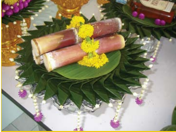
บริวารชั้นหมากนิยมตกแต่งด้วยสัญลักษณ์ อ้อย กล้วย รวงข้าว ขนมะ ผลไม้ เป็นต้น เป็นเครื่องประกอบในการจัดชั้นหมากให้ได้จำนวนตามที่ฝ่ายเจ้าสาวต้องการ 9 ชั้น 15 ชั้น หรือ 21 ชั้น (ภาพถ่าย 11 พฤษภาคม 2552)