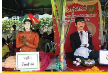
ปัจจุบันมีการเลือกคู่ครองให้ กับหุ่นโตะชุมพุกเพราะแต่ละหมู่บ้าน ได้แยกกันประกอบหุ่นเจ้าบ่าวและ หุ่นเจ้าสาวขึ้นมาแต่ละหมู่บ้าน (ภาพถ่าย 11 พฤษภาคม 2552)