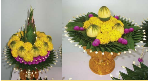
ชั้นหมาก 3 พานเป็นสิ่งสำคัญขาดไม่ได้ รวมเรียกว่า หัวชั้นหมาก หรือชาวบ้านเรียกว่า พานหัว พานคอ และพานคาง ใช้ในสำหรับไหว้ตายาย (ภาพถ่าย 11 พฤษภาคม 2552)

ถวายพระกับการเซ่นไหว้สิ่งศักดิ์สิทธิ์ ภูมิเจ้าที่ ส่วนสัญลักษณ์พิธีกรรมมีการเปลี่ยนแปลง ลักษณะหุ่นให้มีรูปร่างตั้งเทพ ตามวิถีคิดของชาวบ้านได้หยิบยืมเทพตามแบบฉบับอิทธิพลทางศาสนาฮินดูผสมผสานกับความเชื่อตามวิถีการพึ่งพาธรรมชาติ จึงตกแต่งหุ่นให้มีลักษณะท้องป่องๆ คล้ายกับเทพแทนความอุดมสมบูรณ์ ขึ้นมาเป็นตัวแทนชื่อว่าพ่อชุกพุกกับแม่สุนทรี เป็นเทพแห่งความอุดมสมบูรณ์ประจำนาข้าว