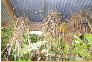
ชาวนาจะเก็บกอซึ่งข้าวไว้กำมือหนึ่งในแปลงของตนเองหลังจากเก็บเกี่ยวข้าวเสร็จแล้ว เพื่อนำมามัดรวมกันช่วงเดือน 6 ในการตกแต่งหุ่นโຕະซຸມພຸກ (ภาพถ่าย 2 มิถุนายน 2551)