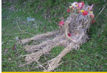
ยุคแรกๆ นำกอซึ่งมามีตรวมกันเพียงให้รู้หุ่นผู้หญิงกับหุ่นผู้ชาย (คู่บ่าวสาว) โดยจัดให้ทั้งคู่เข้าพิธีแต่งงาน (ภาพถ่าย 2 มิถุนายน 2551)