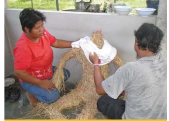
ลักษณะหุ่นโຕະซຸມພຸກในปัจจุบัน มีการออกแบบตามลักษณะหน้าที่ ยศ ตำแหน่งของคนในสังคม แต่ยังคงใช้กอซึ่งข้าวมัดรวมกันตามความเชื่อในพิธีกรรม (ภาพถ่าย 2 มิถุนายน 2551)

อันตรายจากสถานการณ์ความไม่สงบช่วง 2-3 ปีที่ผ่านมา และทัศนคติของชาวนามองว่า อาชีพทำนาลำบาก เหน็ดเหนื่อย มีรายได้ไม่แน่นอน บางปีมีภัยธรรมชาติ บางครอบครัวหันไปประกอบอาชีพอื่น บางครอบครัวบุตรหลานเรียนหนังสือไม่มีแรงงานในครัวเรือน จำเป็นต้องให้พื้นที่นากร้าง แม้ปัจจุบันอาชีพทำนาไม่ได้ยุ่งยากลำบาก และเหน็ดเหนื่อยอย่างในอดีต นอกจากมีรถไถใหญ่และรถเกี่ยวข้าวรับจ้างตามช่วงฤดูกาลทำนาแล้ว ในชุมชนได้จัดซื้อรถไถประจำตำบลเพื่ออำนวยความสะดวกให้กับชาวนาผู้ประสงค์จ้างไถและเกี่ยว ปัจจุบันทำนาได้ปีละ 2 ครั้งจากการสร้างเขื่อนชลประทาน แต่ความสะดวกสบายนำมาสู่ปัญหาและอุปสรรคเหมือนกัน เช่น บริเวณพื้นที่นาอยู่ใกล้ชลประทานถูกน้ำท่วมขังตลอดปี ไม่สามารถทำนาได้เพราะดินเป็นโคลนเหนียว ปัญหาหอยเชอรี่เต็มท้องนา สาเหตุไม่รู้แน่ชัด บางคนบอกว่ามากับน้ำชลประทานบ้าง ไข่หอยเชอรี่ติดกับรถไถใหญ่บ้าง เกิดจากนาร้างบ้าง ซึ่งไม่สามารถแก้ปัญหาได้ การทำนาช่วง 10 ปีที่ผ่านมาลดลงเหลือเพียงไม่กี่ครัวเรือน ประเพณีลาซัง - แต่งงานโຕະซຸມພຸກ : พิธีกรรม