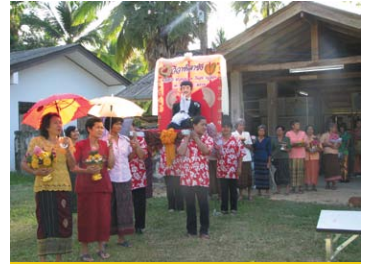
แต่ละหมู่บ้านเริ่มตั้งขบวนแห่หน้าศาลาอเนกประสงค์ของตนเองเพื่อความพร้อมเพรียง และเริ่มเคลื่อนขบวนตามฤกษ์ยามอันเป็นมงคล ไปยังสถานที่ลานกว้างบ้านบ่อโศก (ภาพถ่าย 11 พฤษภาคม 2552)

เฉพาะการเป็นข้าราชการ “เมื่อมีงานด้านวัฒนธรรมเพื่อต้องการให้แต่ละอำเภอเข้าร่วม ประเพณีลาซังได้รับคัดเลือกให้ไปโชว์ในนามของอำเภอปะนาเระ ทำให้เจ้าบ่าวเจ้าสาวทันสมัยขึ้น สวยขึ้น หล่อกขึ้น” (สุพิไล ฝันมะโร, 2552 : สัมภาษณ์)