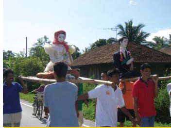
การแห่หุ่นโຕ้ะชุมพุกฝ่ายเจ้าบ่าวไปสู่ขอฝ่ายเจ้าสาวอีกหมู่บ้านหนึ่งแล้วแห่มาพร้อมกันตามถนนเพื่อไปยังสถานที่ประกอบพิธีกรรม (ภาพถ่าย 3 มิถุนายน 2551)