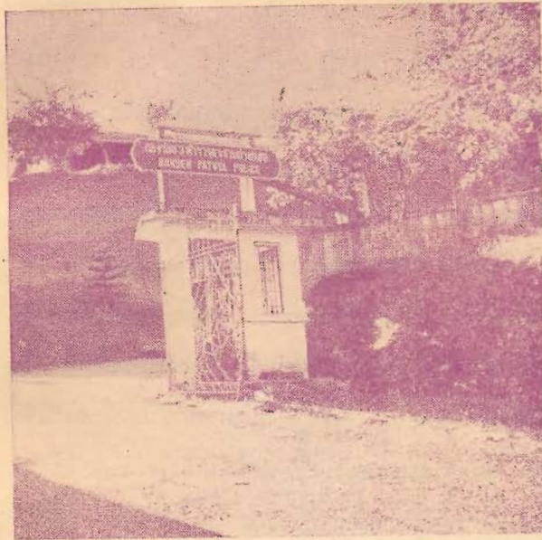
ทางเข้ากองร้อย 8 ตำรวจตระเวนชายแดน

แต่ความจริงเขาเป็นเพียงตำรวจต่างอาศัยกันและกัน เพื่อจะปราบปรามโจรจีนคอมมิวนิสต์เป็นประการสำคัญ”