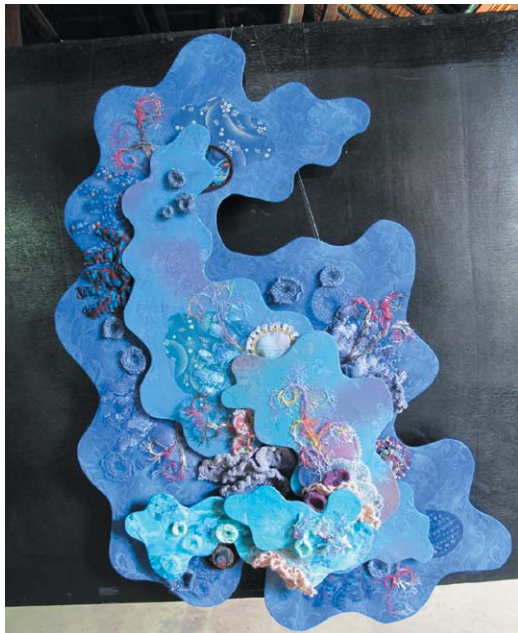
4. นางสาวพันธิศา ต้นไต้ มหาวิทยาลัยบูรพา