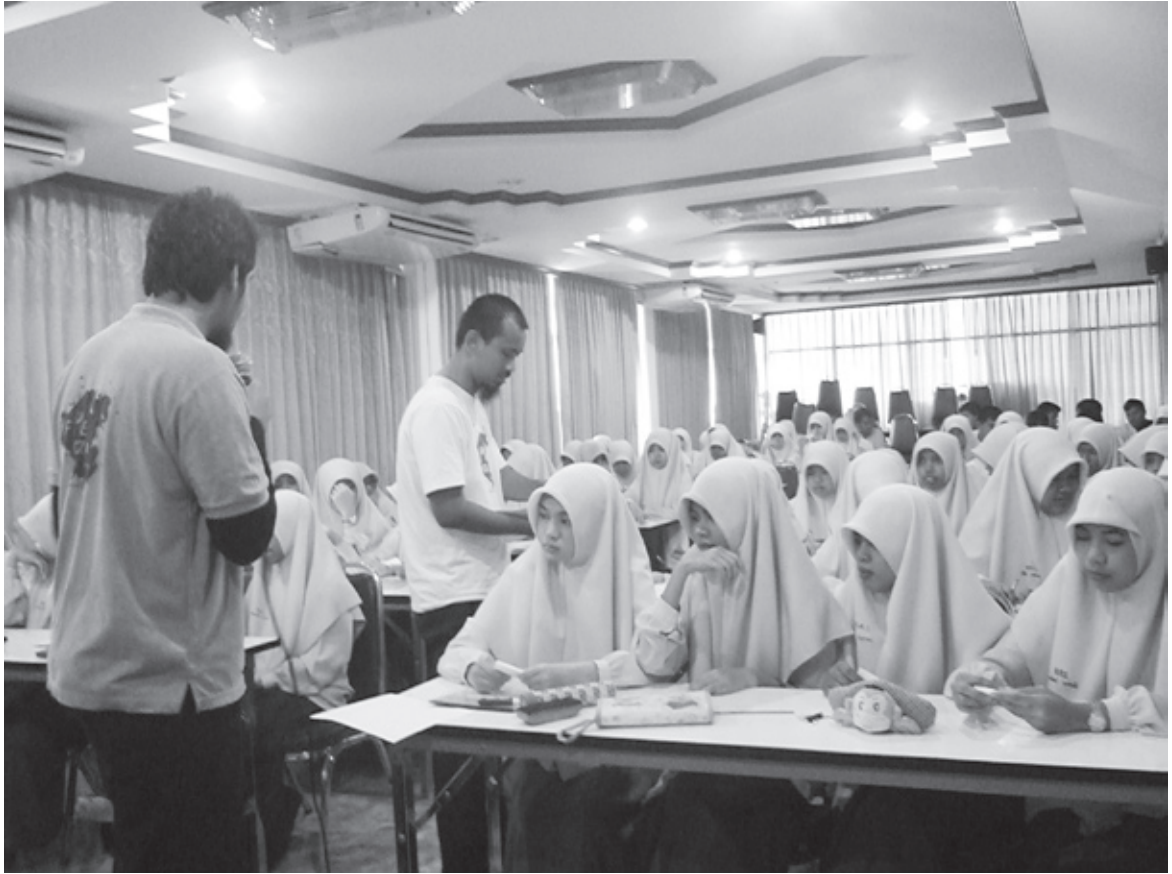
▲ ระหว่างทำกิจกรรมกับเยาวชนมุสลิม

ก็จะลากมาเป็นนักเขียนประจำในโรตีมะตะปะ พิเชฐ : ในการทำหนังสือหรือกิจกรรม วาง โครงสร้างการทำงานไว้อย่างไร