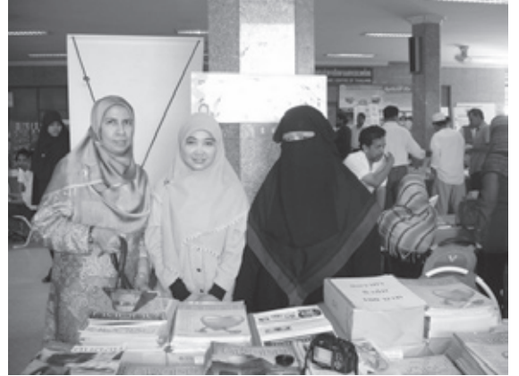
▲ มุมหนึ่งในงานมหกรรมหนังสือเพื่อมุสลิมที่จัดขึ้นทุกปี ตั้งแต่ปี 2550

ที่นี่ก็มีแฟนหนังสือดินไดอารี ที่มีความฝันอยากทำหนังสือ ซึ่งพอได้ข่าวว่าดินไดอารีปิดตัว เขาก็มานั่งคุยด้วย รวบรวมคนที่อยากทำหนังสือ มาได้ 8 คน ก็รวมตัวกันทำนิตยสารเล่มใหม่ ชื่อดินทุเดย์ ออกวางแผงตอนปลายปี 2546 โดยวางโพสิชันหนึ่งว่าเป็นนิตยสารดินไดอารีสำหรับผู้ใหญ่ ดินไดอารีวางกลุ่มเป้าหมายเป็นเยาวชน ที่นี่ปัญหาส่วนหนึ่งคือ ไม่มีโฆษณามาลง เพราะสินค้าที่จะเจาะแต่กลุ่มเป้าหมายที่เป็นวัยรุ่นมุสลิมนั้น มันหายาก แต่หากเราขยับให้