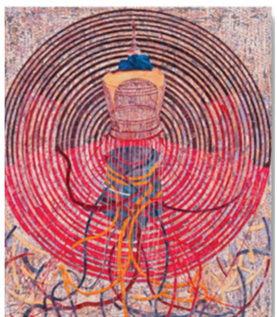
ชื่อศิลปิน : นายปรัชญ์ พิमानแมน ชื่อผลงาน : สัมพันธภาพระหว่างเส้นและรูปทรง หมายเลข 2 เทคนิค : วัสดุผสม ขนาด : 200 x 200 ซม. ภาพผลงานที่ได้รับรางวัลสนับสนุนรุ่นเยาว์