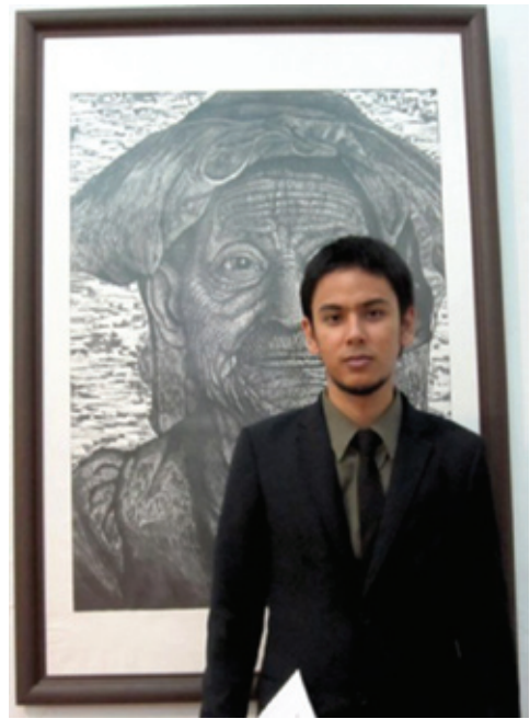
ชื่อศิลปิน : นายอนีส นาคเสวี ชื่อผลงาน : คนที่ห้วงใย เทคนิค : ภาพพิมพ์แกะไม้ ขนาด : 109 x 79 ซม. ภาพผลงานที่ได้รับรางวัลดีเด่น จากการประกวดศิลปกรรม “นำสิ่งที่ดีสู่ชีวิต” ครั้งที่ 22