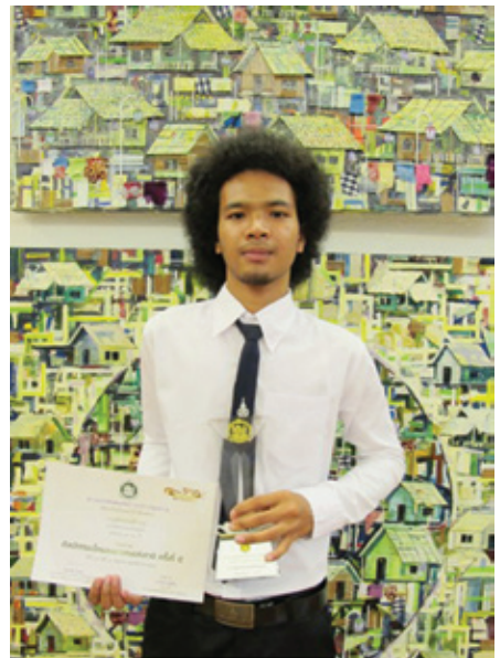
ชื่อศิลปิน : นายมุฮัมหมัดซุรียี มะซู ชื่อผลงาน : วิถีแห่งความสุข เทคนิค : วัสดุผสม ขนาด : 120 x 120 ซม. ภาพผลงาน ที่ได้รับรางวัลศิลปกรรมเหรียญเงิน จากการประกวดศิลปกรรมเด็กและ เยาวชน ครั้งที่ 5