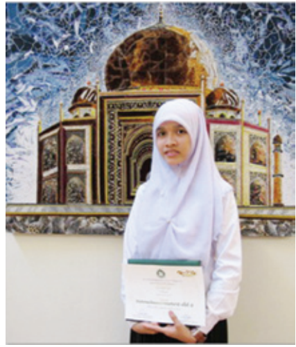
ชื่อศิลปิน : นางสาวามีละห์ หะยี ชื่อผลงาน : ศูนย์รวมแห่งศรัทธา เทคนิค : สื่อผสม ขนาด : 95 x 120 ซม. ภาพผลงาน ที่ได้รับรางวัลชมเชย จากการประกวดศิลปกรรมเด็กและเยาวชน ครั้งที่ 5