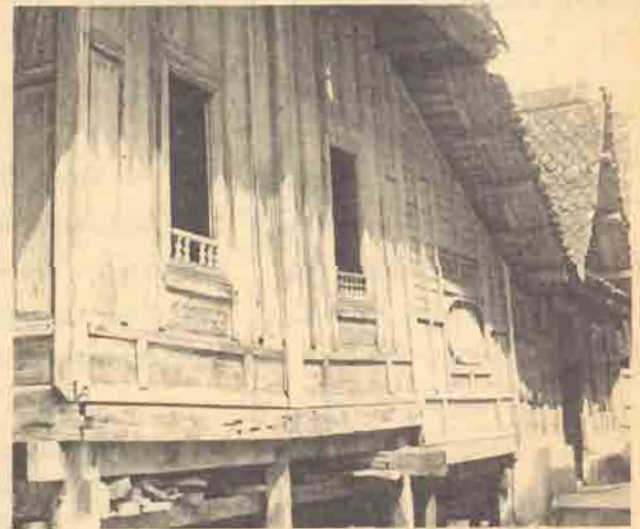
ลวดลายการแกะสลักและฉลุไม้ (ด้านหน้ากุฏิ)