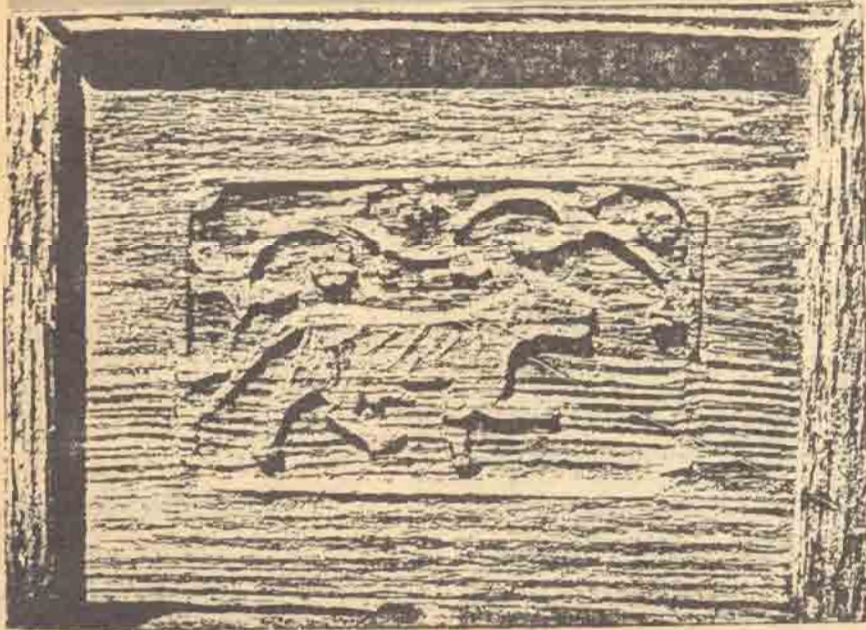
๗๒ รูปสมิถ