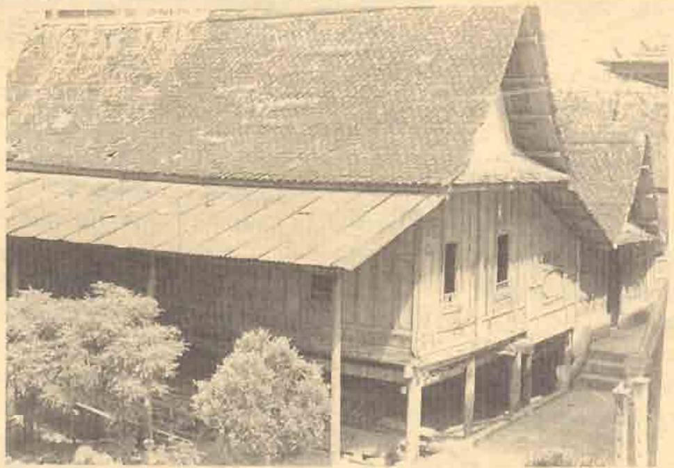
กุฎิทรงไทยวัดวังตะวันตก

วัดวังตะวันตกนั้น ตั้งอยู่ริมถนนราชดำเนินในเขตเทศบาลเมือง อำเภอเมือง จังหวัดนครศรีธรรมราช บริเวณโดยรอบส่วนใหญ่เป็นที่ตั้งของอาคารพาณิชย์ อันสืบเนื่องมาจากบริเวณนี้ในปัจจุบันจัดได้ว่าเป็นศูนย์กลางความเจริญของเมืองนครศรีธรรมราช ด้วยเหตุนี้จึงทำให้กุฎิดังกล่าว ถูกอาคารพาณิชย์ต่างๆ บดบังความงาม จนแทบไม่มีใครเห็นถึงคุณค่าทางศิลปกรรมที่ปรากฏอยู่ภายในวัดแห่งนี้