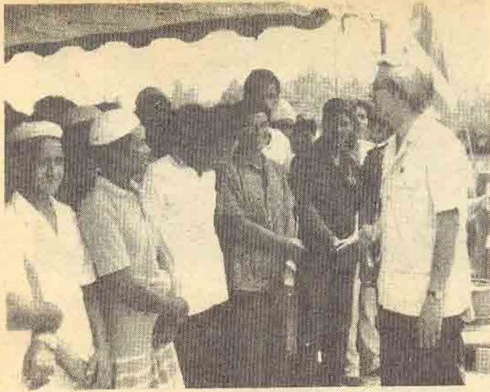
ร.ม.ต.จิรายุ อิศรางกูร ณ อยุธยา ไปตรวจเยี่ยม โครงการสร้างเขื่อนกั้นดินและสะพานท่าเทียบเรือ ที่ ต.บางเตย อ.เมือง จ.พังงา