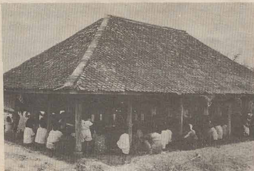
๕๒ รุสมิแล