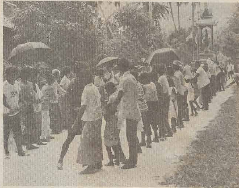
ประเพณี เรืองณรงค์