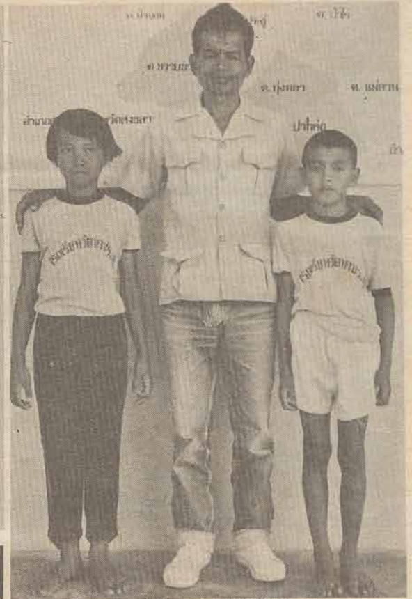
"นักข่าวรูสมิแล"