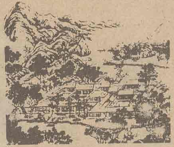
ส่วนหนึ่งของอุทยาน

อุทยานทั้ง 3 แห่งนี้ ก่อสร้างก่อนอุทยานเหวิยนหมิง อุทยานชิงหัว (ขณะนี้เป็นที่ตั้งของมหาวิทยาลัยชิงหัว) สร้างตั้งแต่ราชวงศ์หมิงแต่เดิมชื่อ หลี่เหวิยน พระเจ้าแผ่นดินในศักราชก่งซี ได้สร้างอุทยานชิงอี่เหวิยน ณ ที่นี้ เพื่อปรนนิบัติต่อพระชนนี ทางเหนือของชิงอี่เหวิยน ก็ได้สร้างอุทยานเอวี่ยนหมิงเพื่อทรงโปรดถวายให้กับเจ้าชายองค์ที่ 4 (เป็นกษัตริย์ในศักราชหย่งเจิ้ง) เพราะฉะนั้นอุทยานเหวิยนหมิงก็คือทำเนียบขององค์ชาย 4 อุทยานแห่งนี้ได้ตกแต่งเมื่อศักราชหย่งเจิ้ง ในปีที่ 3 ที่นี้มีข้อความบันทึกของกษัตริย์ศักราช เจียนหลง ได้เขียนการบันทึกเหวิยนหมิง เพื่อเป็นรากฐานได้บันทึกว่า ทิวทัศน์แม้เป็นแบบเก่า แต่ทางด้าน การก่อสร้างได้สร้างเพิ่มขึ้น เพื่อกษัตริย์ศักราชหย่งเจิ้ง เวลาที่รับสั่งพระราชโองการ ในอุทยาน เพื่อปราศจากพิธีรีตองในราชสำนัก ถ้าเราไปได้สำรวจดูตามเศษเหลือของซากก้อนหินที่แกะสลักนั้น จะเห็นได้ว่าสมัยนั้นอุทยานเหวิยนหมิงมีหอเรือนยังไม่