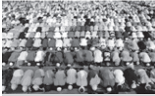
มุสลิมละหมาดร่วมกัน สำเนาภาพจาก www.sunnahstudent.com/ forum/index.php?topic=2...