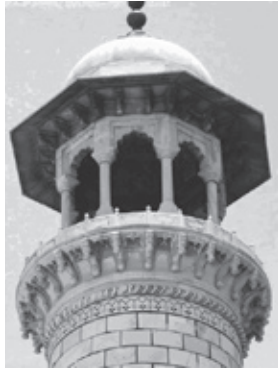
หอออะซาน

เพื่อเป็นการสร้างความเข้าใจที่ดียิ่งขึ้นข้าพเจ้า จึงได้นำคำอะซาน และความหมายของการอะซาน มาสรุปให้เข้าใจอย่างคร่าวๆ ดังต่อไปนี้