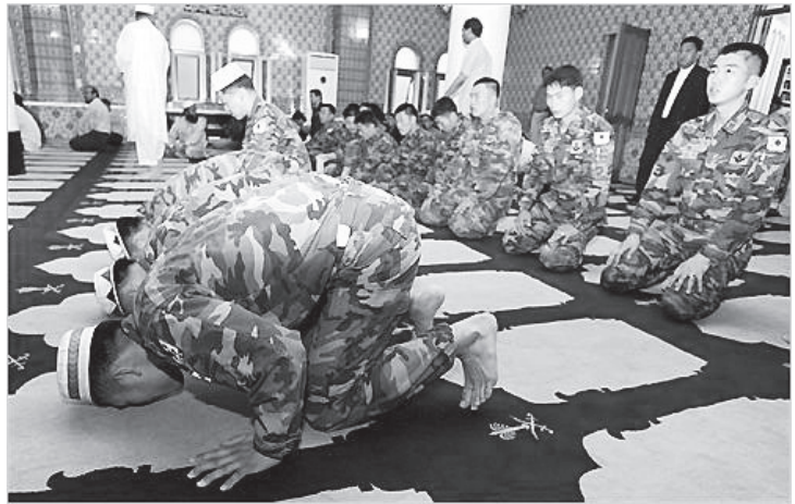
▲ ทหารเกาหลีลี้ภัยที่มัสยิดฮัมนัน-ดง หลังปฏิญาณตนรับอิสลาม