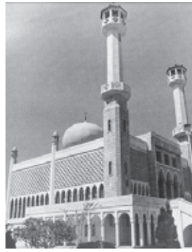
▲ มัสยิดกลางแห่งกรุงโซล