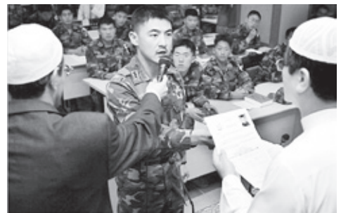
▲ นายพันชงจิน-กู จากกองพัน ชัยตุ กล่าวปฏิญาณตนเป็นมุสลิมที่มีสยิดฮัมมันดง

สงครามเกาหลีด้วย ทั้งสองเป็นทหารที่กองทัพตุรกีส่งเข้ามาให้การช่วยเหลือทหารและชาวเกาหลีผู้ได้รับผลกระทบจากสงคราม ระหว่างสงคราม ทั้งสองได้สร้างกระท่อมเล็กๆ ขึ้นในค่ายเพื่อใช้แทนมัสยิด