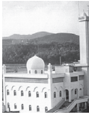
▲ มัสยิดเมืองควางจู