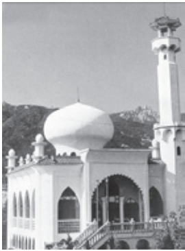
▲ มัสยิดเมืองบูฆาน