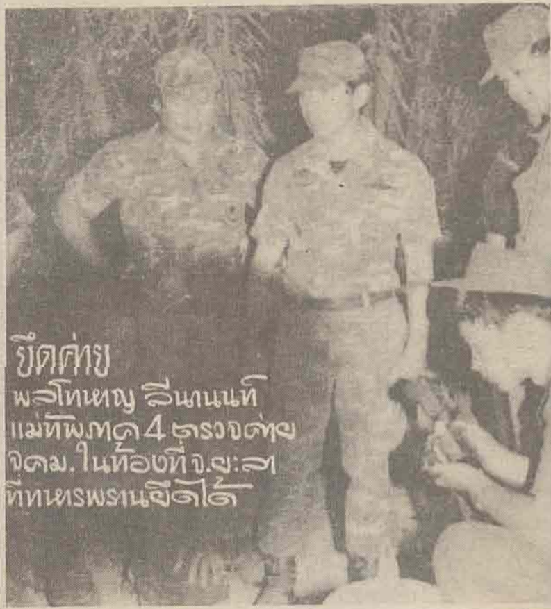
ยึดค่าย พลโทหญิง วิไลนันท์ แม่ทัพภาค 4 ตรงจุดฯ จดม. ในห้องที่ จ.๗:๗1 ทิทเทรพรณชีตได้

สงขลา หรือที่เรียกว่า "ศูนย์รวมรถ เมลล์" ตั้งอยู่บริเวณศูนย์การค้าหาดใหญ่ สแควร์ และไม่ยอมวิ่งในเส้นทางที่เทศบาลกับขนส่งจังหวัดกำหนดได้ก็กลาย ลงแล้ว หลังจากที่มีการประท้วงของ บรรดารถเมล์มาตลอด แต่เจ้าหน้าที่ ไม่ยอมตามที่ประท้วง เพียงผ่อนผันให้ วิ่งรับผ่านในเมืองหาดใหญ่ได้ และนัด ประชุมตัวแทนฝ่ายต่าง ๆ อีกครั้ง