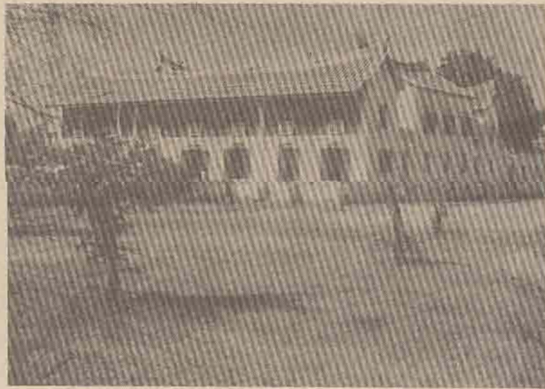
อาคารพิพิธภัณฑสถานแห่งชาติ จ.สงขลา หลังจากบูรณะซ่อมแซม

ฝ่ายกำลัง พ.ต.ท.42 สุราษฎร์ธานี จำนวน 70 นาย เข้าตีค่าย ผกค. เขตงานที่ 537 บ้านเหนือคลอง 2 เทือกเขาปลายเบี่ยง หมู่ 6 ต.ห้วยปรือ อ. นบวง จ.นครศรีธรรมราช ซึ่งสืบทราบ ว่ากำลัง ผกค. ได้ลักลอบตัดไม้ทำลายป่ากันอย่างมโหฬาร ปรากฏว่าได้เกิดปะทะกับผกค. ประปราย หลังจากเข้าเคลียร์พื้นที่แล้ว พบไม้ซุงจำนวน 150 ท่อน และไม้แปรรูปอีกจำนวนมาก จับกุมผู้ต้องหาได้ 2 คน คือ นายนิคม กุณฑล และนายพิศ กุณฑล