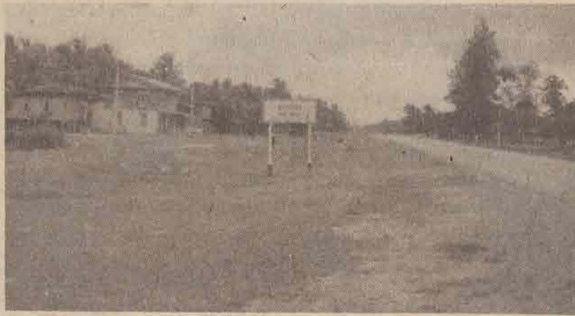
หมู่บ้านขามมาเป็ลอุบล

“ในแผ่นดินพระบาทสมเด็จพระพุทธยอดฟ้าจุฬาโลก เมื่อจุลศักราช 1147 (พ.ศ. 2328) กรมพระราชวังบวรสถานมงคลเสด็จยกกองทัพออกไปปราบปรามศึกพม่าทางหัวเมืองฝ่ายตะวันตก ครั้นกองทัพออกไปถึงเมืองสงขลา มีข่าวเข้ามาว่าเมืองตานีก่อการกำเริบจึงโปรดเกล้าให้พระยาตากาโหม พระยาเสนาหาญอร (ทองอิน) พระยาพัทลุง (ทองขาว) หลวงสุวรรณคีรี (บุญสุข) ยกออกไปตีเมืองตานี ได้สู้รบกับคาตูปะกาตันที่ตำบลลิริง คาตูปะกาตันสู้ไม่ได้ ก็อพยพแตกหนีไปทางเมืองรามันห์ พระยาตากาโหมแม่ทัพเห็นว่า ปลัดจนะนะ (ขวัญชัย) เป็นผู้รู้จักทาง ก็แต่งกองรวมคนพัทลุง สงขลา ให้ปลัดจนะนะ (ขวัญชัย) เป็นหัวหน้าตามตีคาตูปะกาตัน ปลัดจนะนะตามคาตูปะกาตันไปพื้นที่ที่ปลายน้ำเมืองรามันห์ ริมแดนเมืองประจักษ์ ได้สู้รบกันในตำบลนั้น คาตูปะกาตันถูกกระสุนปืนตาย