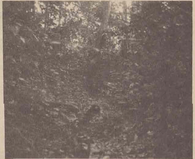
คลองที่ล้อมรอบกำแพงดิน ขณะมีต้นเงินไม่มีน้ำ

ครั้งที่สาม ได้อพยพเคลื่อนย้ายมาตั้ง เมืองที่ “บ้านประเว” คือเมืองยะรังเก่า ใน ท้องที่ตำบลยะรัง อำเภอยะรัง จังหวัดบัตตานี