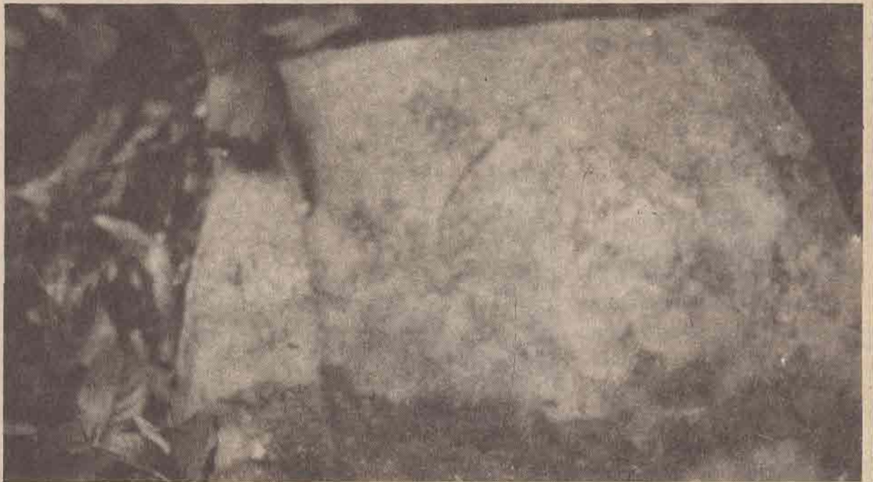
(1) ขุนศิลปกิจพิสัยนท์. "เดทพาดาก" คู่มือตานี (มหาวิทยาลัยของชวาครินทร์, 2525), หน้า 70-71.

ก่อนหินมีรอยสลักเป็นรูปสี่เหลี่ยม พบ ใกล้ซากเจดีย์ที่ปะนาเระ