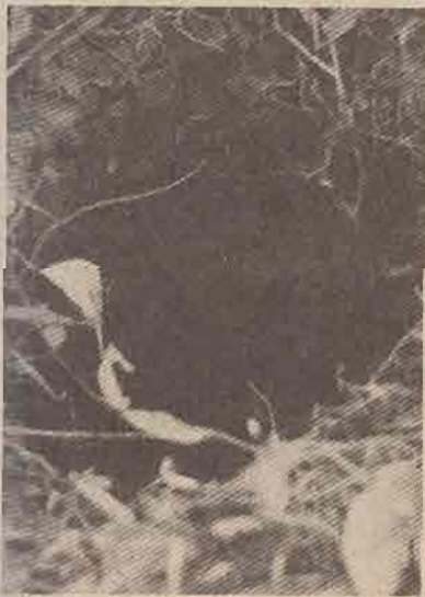
(1) พิพิธ อารวฤต. การอ่านแผนที่และรูปถ่ายทางอากาศ. (กรุงเทพมหานคร : กรมแผนที่ทหาร, 2523).

ในด้านการใช้ประโยชน์เพื่อการศึกษา เมืองโบราณนั้น ภาพถ่ายทางอากาศเป็นทั้งเครื่องมือและแหล่งข้อมูล กล่าวคือภาพถ่ายทางอากาศช่วยในการพิจารณาขอบเขตของอาณาบริเวณที่ศึกษา ช่วยในการค้นหาและกำหนดตำแหน่งที่จะทำการตรวจสอบภาคสนาม ในขณะที่ช่วงที่ภาพถ่ายทางอากาศได้บรรจุข้อมูลพื้นผิวทั้งในส่วนที่เป็นธรรมชาติและมนุษย์สร้างขึ้นตามที่ปรากฏบนพื้นที่นั้น ๆ ขณะที่มีการถ่ายภาพไว้ทุกประการ ลักษณะต่าง ๆ ที่ปรากฏบนภาพถ่ายทางอากาศจึงถือว่าเป็นข้อมูลที่เป็นประโยชน์ต่อการศึกษาทั้งสิ้น ภาพถ่ายทางอากาศที่บันทึกไว้ต่างระยะเวลา กัน จะชี้ให้เห็นถึงลักษณะการเปลี่ยนแปลงของพื้นที่นั้น ๆ ได้เป็นอย่างดี ยิ่งบันทึกไว้นานมากเท่าใดก็จะทำให้เห็นรายละเอียดของพื้นที่ที่ศึกษาได้ชัดเจนยิ่งขึ้นเท่านั้น แต่การผลิตภาพถ่ายทางอากาศเพื่อใช้งานนั้นเป็นของใหม่ เริ่มใช้กันในประเศยุโรป เมื่อประมาณ 100 ปีที่ผ่านมาสำหรับประเทศไทยนั้น