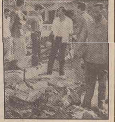
โรงเรียนโรงเรียนสยามธานีโดนระเบิด -

งาน ลูกจ้างหน่วยงานราชการหรือรัฐวิสาหกิจ ข้าราชการพลเรือน ตำรวจ ทหาร ซึ่งมีหน้าที่รักษาความสงบเรียบร้อยหรือปราบปรามผู้กระทำความผิดกฎหมาย จะพกพาอาวุธปืนได้แต่เฉพาะในขณะปฏิบัติราชการตามหน้าที่ และแต่งเครื่องแบบเท่านั้น ผู้ใดฝ่าฝืนจะถูกดำเนินคดีตามกฎหมายอย่างเฉียบขาดต่อไป