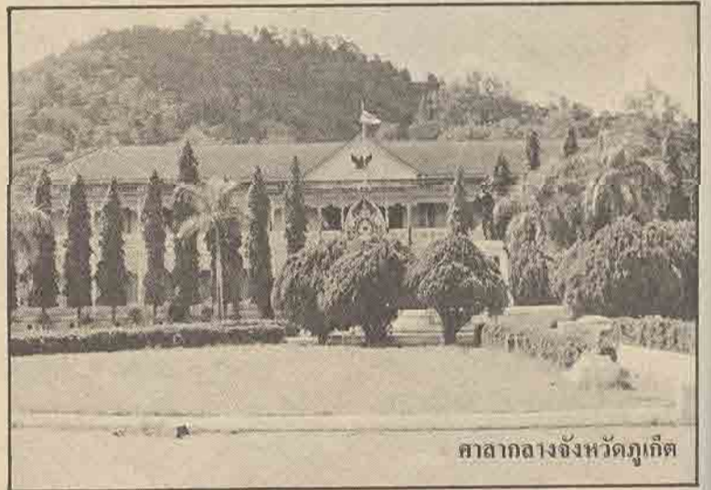
ศาลากลางจังหวัดภูเก็ต

ในวันที่ ๒๒ กุมภาพันธ์ ๒๕๒๖ ได้มีการเจาะตรวจบริเวณพระนาภี ของพระพุทธรูปปางมารวิชัย ทั้ง ๓ องค์ พบว่ามีเศียรพระพุทธรูปหลุดด้วยโลหะ (ซึ่งมีส่วนผสมของดีบุกเป็นสำคัญ) อยู่ภายในโดยเศียรพระที่พบในองค์กลาง (ประธาน) เป็นเศียรพระพุทธรูปธรรมดา ส่วนอีก ๒ เศียร ที่พบในพระพุทธรูปด้านข้าง เป็นเศียรพระพุทธรูปทรงเครื่อง เศียรพระพุทธรูปโลหะเหล่านี้ น่าจะมีอายุในช่วงสมัยอยุธยาตอนปลาย ราวพุทธศตวรรษ ที่ ๒๒ โดยประมาณ