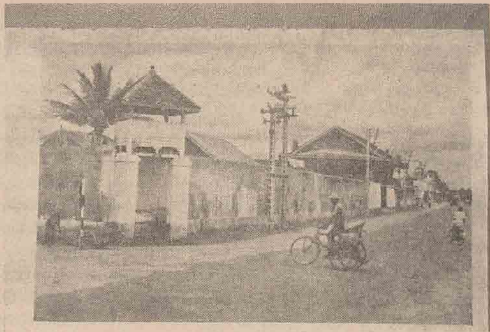
เรือนจำเก่าปัจจุบันเป็นย่านการค้าสำคัญของปัตตานี

บนถนนมากกว่าเมื่อตอนเช้า ผมเดินไปทางหน้าเรือนจำ (เรือนจำเก่า ริมถนนพิพิธในปัจจุบัน) ตรงกันข้ามกับหน้าประตูเรือนจำ มีร้านเครื่องคั้นของอาโกคนจีนอยู่ร้านหนึ่ง ผมจำชื่อเขาไม่ได้ เขาขายเหล้า ขายกาแฟ แต่วันนี้ยังไม่เปิดขาย พูดคุยกับเขา ๒-๓ คำในฐานะคนรู้จักกัน แล้วผมก็เดินผ่านไป วกเข้าสู่ถนนเอกชน ซึ่งเป็นถนนในพื้นที่ที่ตั้งโรงไฟฟ้า โรงน้ำแข็ง และโรงสีข้าว ของขุนธำรงพันธ์ภักดี ไปทะลุตรงปากทางถนนจะบังติกอ