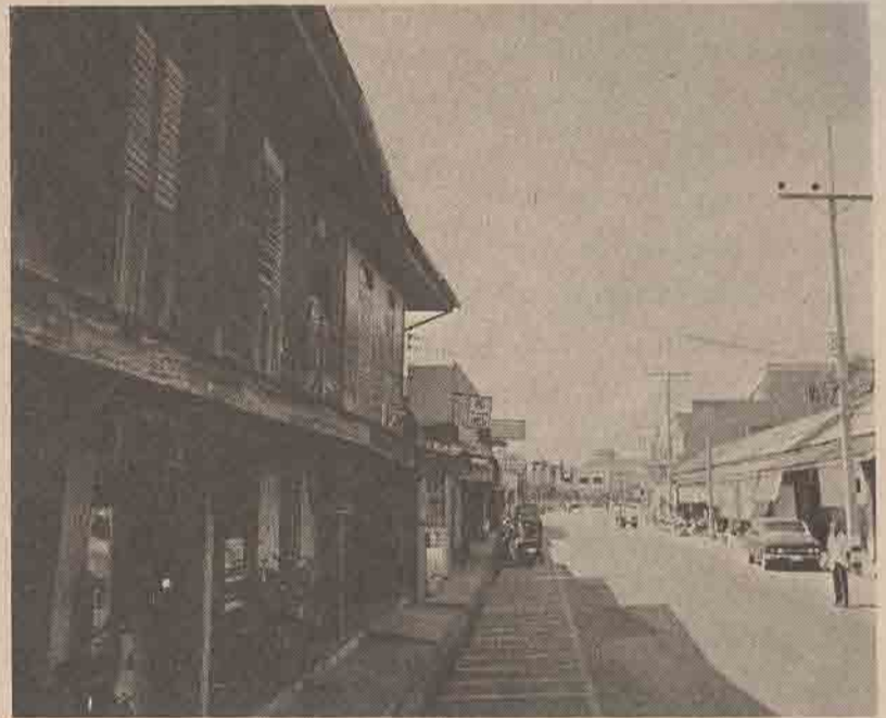
ร้านก๋วยเตี๋ยวห้องแถวเก่า ๆ ถนนปัดตานีภิรมย์

เพื่อให้ชัคกับสายตา ผมจึงแอบมาหลบซ่อนตัวอยู่ข้างมุมร้านอาโก สองคนที่นั่งค้มกันอย่างสนุกสนานก็กรันก็คือเจ้าผู้ป่วนขึ้นมาตนเอง ส่วนอีกคนหนึ่งคือสามล้อชาวไทยมุสลิมนั้น นั่งคาปรืออยู่เฉย ๆ เจ้าผู้ป่วนบังคับให้เขาค้มบ่อ ๆ ทั้งกระดุนความรู้สึกเขาด้วยการตบหลังคบัลท์ ก็ไม่เป็นผล เขาไม่ยอม