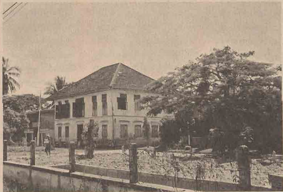
ตึกขาว ปัจจุบันเป็นที่ทำการ คณะกรรมการสามัญศึกษา จังหวัดปัตตานี

ยื่นเหม่อมองไปทางสะพานใจอยากจะข้ามฟากไปดูวิวรอยของการต่อสู้เมื่อวานนี้บ้าง แต่ก็ยังไม่กล้าข้ามไป เพราะยังไม่มั่นใจว่าจะปลอดภัย ถึงแม้ว่ายุติการต่อสู้กันไปแล้วก็ตาม แต่ใครจะรับรองว่าไม่มีเหตุการณ์อะไรเกิดขึ้นกับชีวิตเราได้ เพลินคิดจนกระทั่งได้ยินเสียงฝีเท้าเดินมาข้างหลัง ผมหันไปดู ก็พบว่าผู้เดินมานั้นเป็นชายไทยวัยกลางคนคนหนึ่ง ผมไม่รู้จัก เขาเดินมาจากไหนก็ไม่รู้ รู้ ๆ ก็มาไกลถึงตัวแล้ว ก็เลยทักทายได้ถาม เขาก็หยุดและสนทนาด้วย ผลสุดท้ายการพูดคุยก็ไปลงเอยด้วยเรื่องเกี่ยวกับญี่ปุ่นบุก พอเข้าสู่เรื่องนี้ เขามีกิริยา