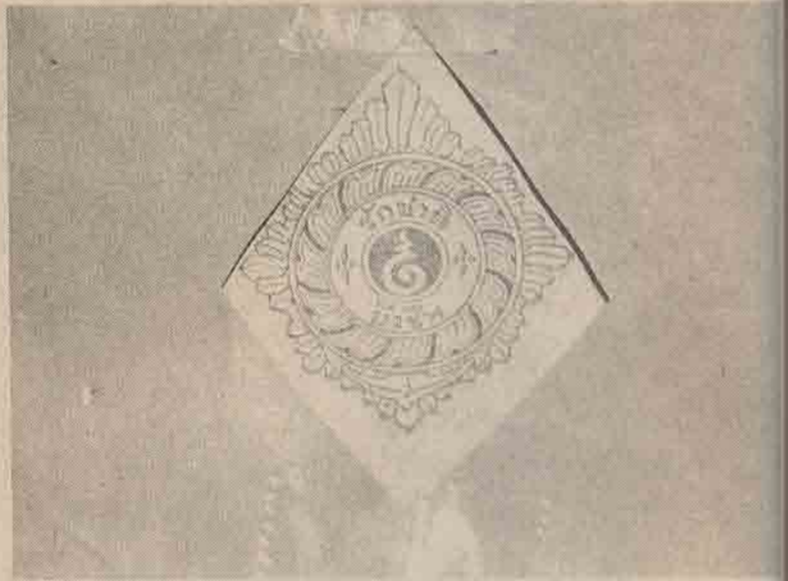
เครื่องหมายเยาวชนทหาร