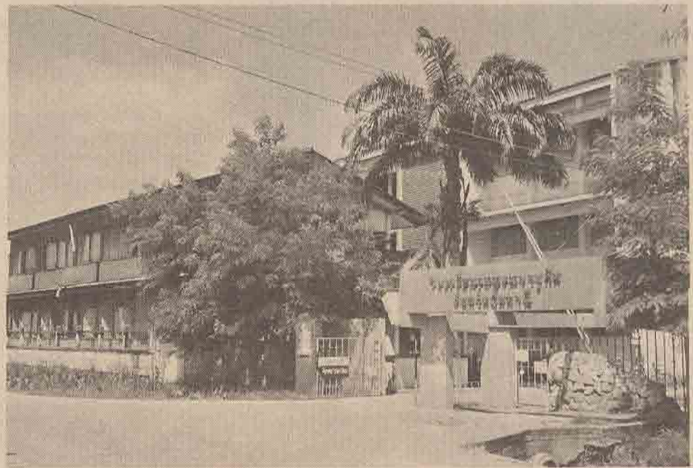
ปากทางเข้าโรงเรียนเบญจมราชูทิศปัจจุบัน

กำลังนั่งคิดเพลิน ๆ ก็ถึงกับสะดุ้ง เมื่อได้ยินเสียงคนทำพรีบ ๆ เต็กไกลเบื้องหน้า ผมเงยหน้าขึ้นแล้วสายตาที่ประสพกับแถวทหารญี่ปุ่นซึ่งกำลังข้ามสะพานมาประมาณ ๓๐ คน