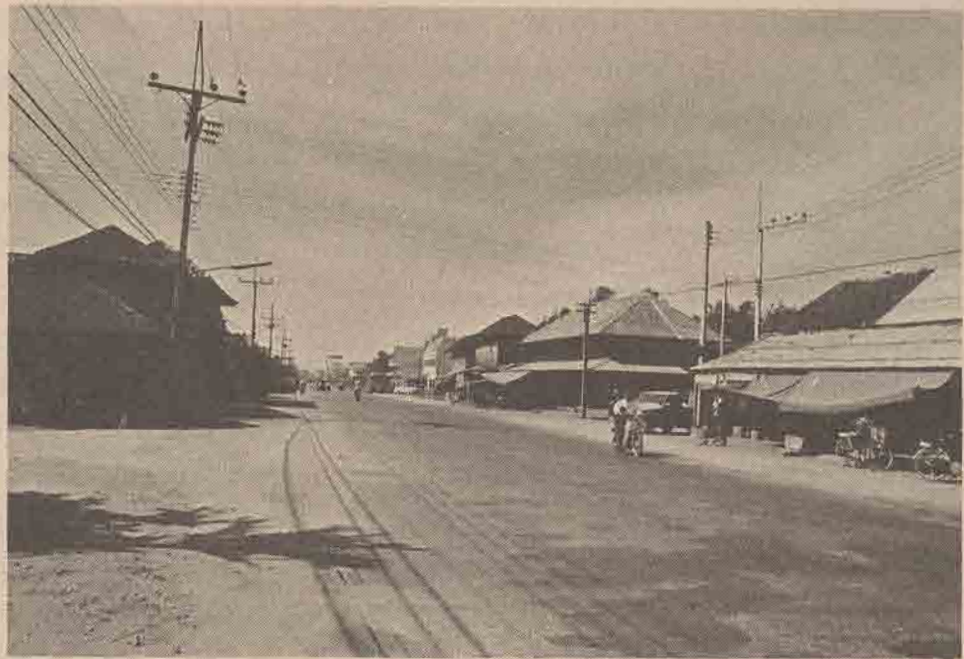
ย่านถนนกะลาพอเป็นที่เก่าแก่แห่งหนึ่งทางปัตตานี เป็นเส้นทาง จากตัวเมืองปัตตานีไปสู่อำเภอยะรังและยะลา

แปลมงกุฎ” ประการที่สอง เขามี สติปัญญาไม่หัดเทียมเพื่อนการ เรียนของเขาอยู่ในเกณฑ์ต่ำ ทั้ง ๆ ที่เขามีใจคนเหลวไหลในด้านการ ศึกษา และประการสุดท้ายฐานะ ทางบ้านของเขาก็ค่อนข้างฝืดเคือง ...นี่แหละคือสิ่งที่เขามักจะคิด ออกห่างจากเพื่อนฝูง มักจะมีอคติ ต่อเพื่อน คิดว่าเพื่อนรังเกียจบ้าง เพื่อนทับถมตัวเองบ้าง