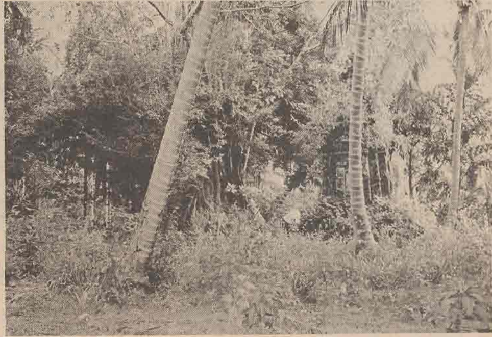
เจดีย์ ๒ องค์ในบริเวณวัดใน ต.บ้านใต้ อ.เกาะพะงัน จ.สุราษฎร์ธานี

อายุสมัยจากการเปรียบเทียบ เจดีย์ที่วัดในแห่งนี้ เมื่อศึกษาโดยการเปรียบเทียบกับโบราณสถานในบริเวณใกล้เคียงประกอบกับการศึกษาจากรูปทรงและลวดลายต่าง ๆ ประกอบ สันนิษฐานได้ว่าน่าจะมีความคล้ายคลึงกับโบราณสถานในเขตจังหวัดสุราษฎร์ธานี บางแห่ง เช่น โบราณสถาน (เจดีย์) วัดเขาพระอานนท์ อ.พุนพิน และ