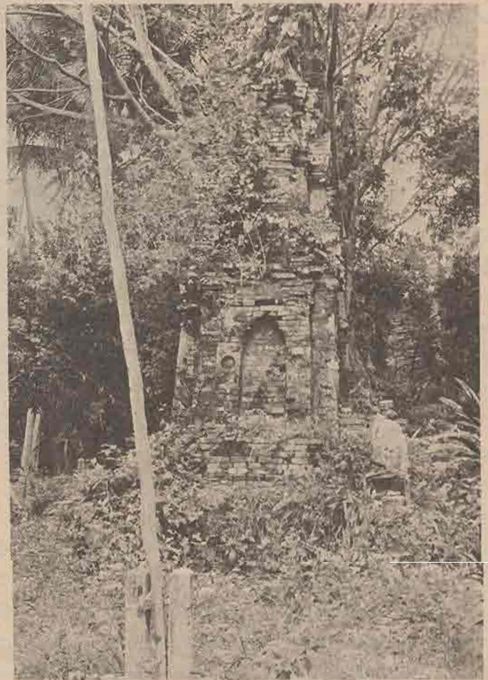
เจดีย์องค์ด้านทิศใต้ ของวัดใน

ส่วนต่อจากฐานเชิงขึ้นไปเป็นฐานปัทม์ซึ่งรองรับเรือนธาตุตรงชั้นบัวหงายของฐานปัทม์ ทำเป็นลายกลีบบัวประดับโดยรอบ ส่วนเรือนธาตุทำเป็นซุ้มโถงทางด้านหน้า (ทิศตะวันออก) โดยมีบันไดทางขึ้นต่อมาจากฐานเชิงส่วนอีก ๓ ด้านของเรือนธาตุทำเป็นซุ้มหลอก เข้าใจว่าแต่เดิมคงมีภาพปูนปั้นประดับอยู่ แต่ในปัจจุบัน