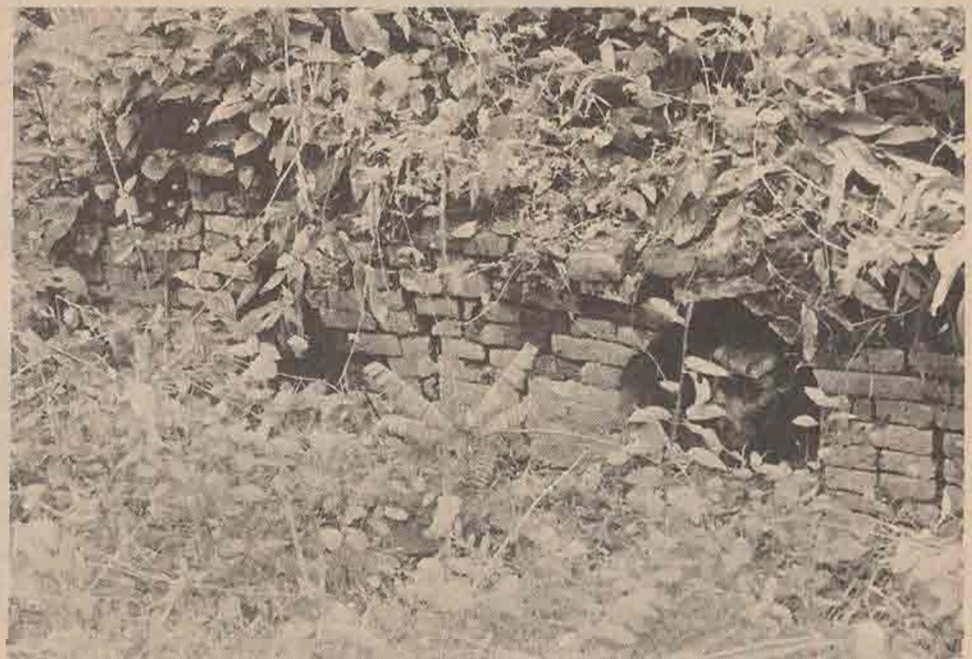
ฐานเจดีย์องค์ด้านทิศใต้ มีปูนปั้นรูปหัวช้างอยู่ภายในซุ้ม

พังทลายไปแล้ว คงมีเฉพาะทางซุ้ม ด้านทิศเหนือที่ทำเป็นภาพปูนปั้น รูปยักษ์ถือกระบองยืนเหยียบบน ศีรษะของยักษ์ (มาร?) อีกคนหนึ่ง โดยอาจจะมีความหมายถึง ท้าว