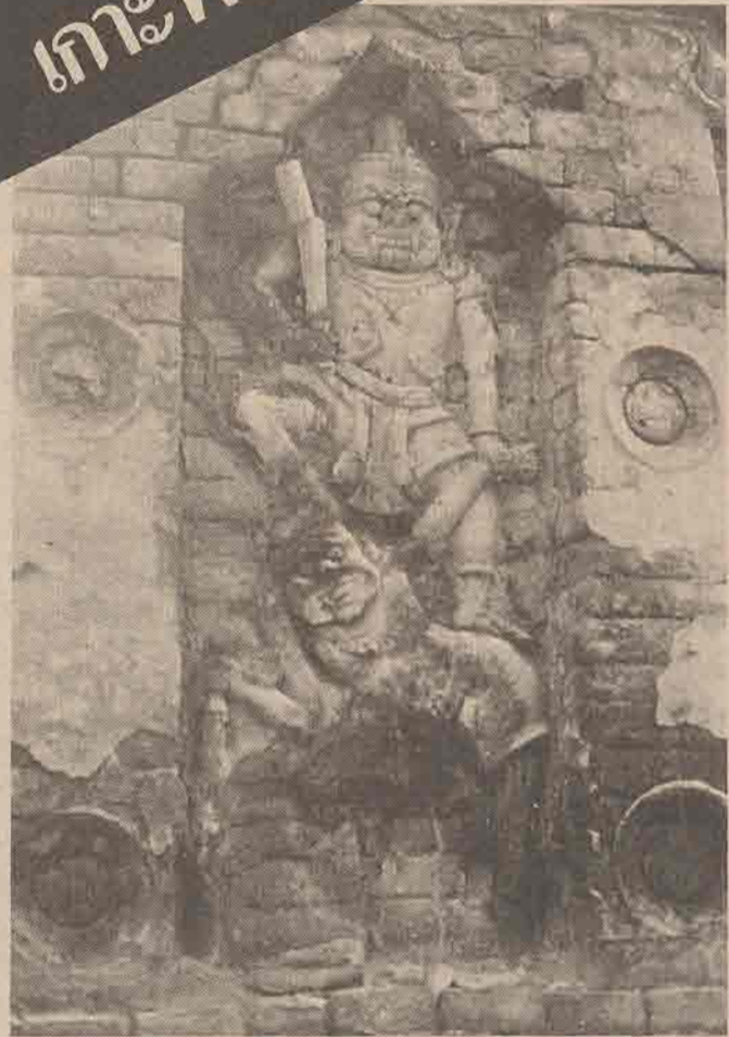
ภาพปูนปั้นรูปยักษ์ ภายในซุ้มหลอกด้านทิศเหนือของเจดีย์องค์ด้านทิศใต้

เกาะพะงัน เป็นส่วนหนึ่งของอำเภอเกาะพะงัน ซึ่งขึ้นอยู่กัวจังหวัดสุราษฎร์ธานี โดยอยู่ห่างออกไปประมาณ ๑๐๐ กิโลเมตร จากตัวจังหวัดและห่างจากเกาะสมุยไปทาง