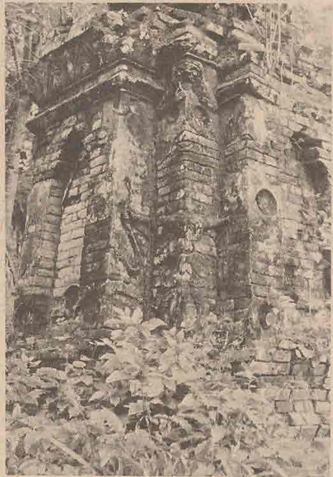
มุมเจดีย์ส่วนเรือนธาตุด้านทิศตะวันตกเฉียงใต้ ของเจดีย์องค์ด้านทิศใต้

ท้ายบท : จากเกาะพะงัน เป็นที่น่าเสียดายที่ระยะเวลาที่อยู่อย่างจำกัด ทางผู้สำรวจจึงมีโอกาสดูเฉพาะ “วัดใน” เพียงแห่งเดียวเท่านั้น ทั้ง ๆ ที่เกาะพะงัน มีเรื่องราวเกี่ยวกับสถานที่สำคัญและวัฒนธรรมให้ศึกษาได้