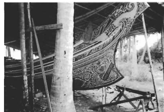
☞ เรือกอบและที่ตกแต่งลวดลายจิตรกรรมเรียบร้อยแล้ว

ศิลปะอิสลาม ได้แก่ ลวดลาย พรรณไม้ แบบเถาเลื้อย ช่างมะแอใช้เวลาประมาณ 1 เดือนในการตกแต่ง ลวดลายจิตรกรรมสร้างความอลังการให้แก่เรือกอบและลำนี้ คุณค่าของเรือกอบและที่เป็นรูปธรรมที่สุด คือ การใช้เป็นยานพาหนะสำหรับประกอบอาชีพประมงใน เขตจังหวัดชายแดนภาคใต้ เรือกอบและสามารถบอก เรื่องราวในประวัติศาสตร์ ชาวประมงใช้เรือกอบและ