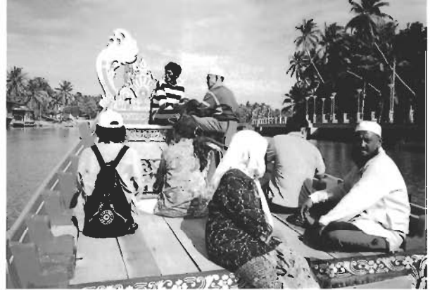
☞ กอลำและพวงไปเบื้องหน้าในลุ่มน้ำตาหิรัญให้ปวงชนต่อไป

เรือกอลำและเป็นวัฒนธรรมทางศิลปกรรมของกลุ่มชนพื้นบ้านภาคใต้ที่สามารถสะท้อนการแสดงออกของวัฒนธรรมสัมพันธ์ระหว่างศิลปะไทย ศิลปะจีน และศิลปะอิสลามที่ผสมผสานเข้าด้วยกันอย่างกลมกลืน จึงนับได้ว่าเรือกอลำและโปงลางเป็นมรดกทางวัฒนธรรมที่ทรงคุณค่าแก่การสืบทอดต่อไปเป็นอย่างยิ่ง