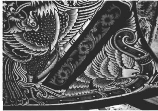
☞ ภาพพญาอินทรี