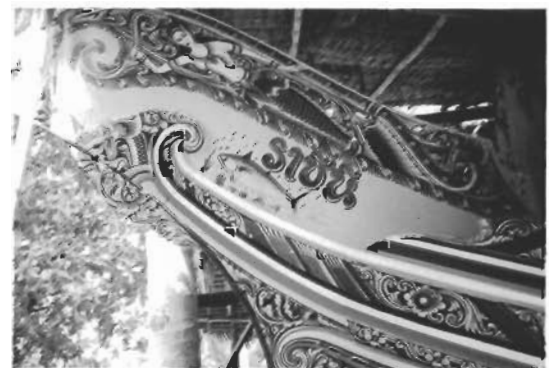
ภาพนางเงือกบนใบหัวเรืออีกด้านหนึ่ง