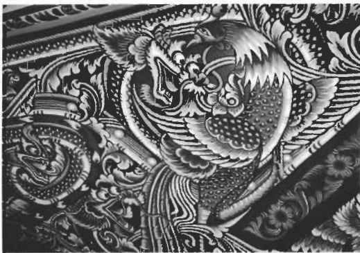
☞ ภาพมังกรและไก่อัน