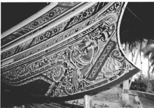
☞ การตกแต่งลวดลายจิตรกรรมบนกราบเรือด้านล่าง