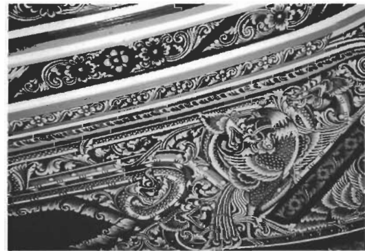
☞ ภาพมังกรทั้งสี่กับไก่อัน