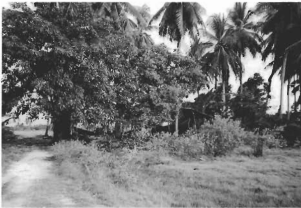
อู่ต่อเรือกอกและในสวนมะพร้าวที่รูสะมิแล

เมื่อต้นปี 2544 นี้เอง มีผู้ว่าจ้างให้คุณแวฮามะต่อเรือกอกและแบบดั้งเดิม ยาว 27 ศอก (1 ศอก