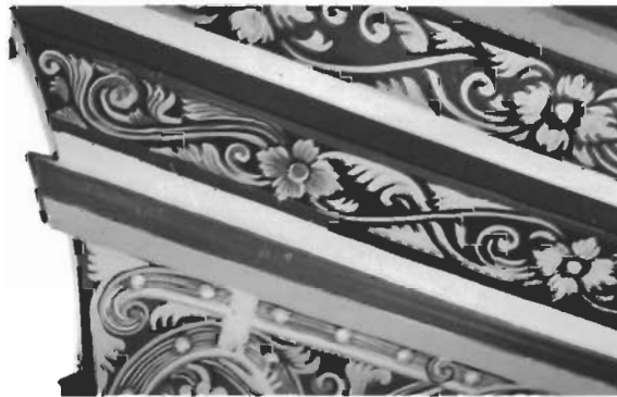
การตกแต่งลวดลายด้วยสีเข้มเพื่อความคมชัด

ส่วนที่เป็นภาพหุมนานหรือนางเงือก ใช้วิธีการเกลี่ยสีเพื่อให้เกิดความกลมกลืน