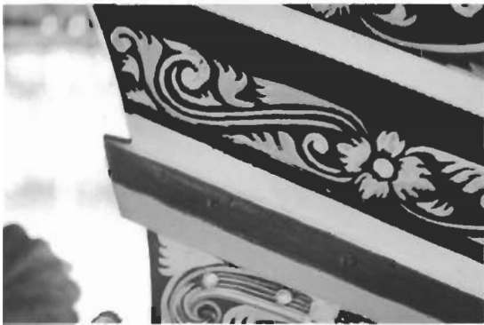
การระบายสีอ่อนเป็นพื้น

ศิลปะจีน และศิลปะอิสลาม (Islamic Art) ศิลปะไทย ที่ปรากฏบนเรือกอและ ได้แก่ ลวดลายไทย และสัตว์ในจินตนาการในปาหิมพานต์ ศิลปะจีน ได้แก่ ภาพสัตว์ในจินตนาการของจีน เช่น มังกร กิเลน นกยูง และ นกกระเรียน