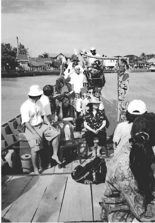
☞ ภายในเรือกอลำที่ใหญ่ที่สุดในโลก