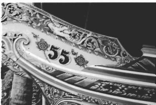
ภาพหุมนานบนใบหัวเรือกอและ

ส่วนที่เป็นภาพหุมนานหรือนางเงือก ใช้วิธีการเกลี่ยสีเพื่อให้เกิดความกลมกลืน