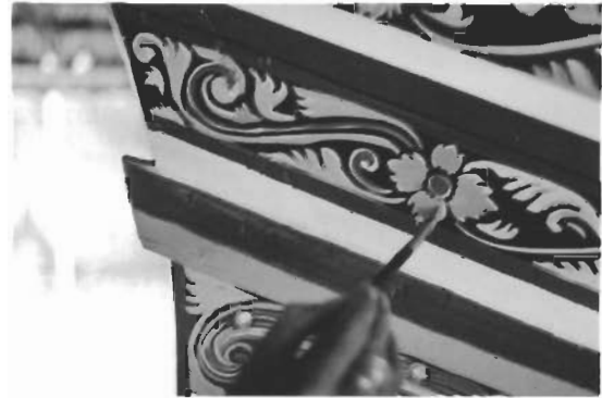
การระบายสีเข้มขึ้นในส่วนของเขา