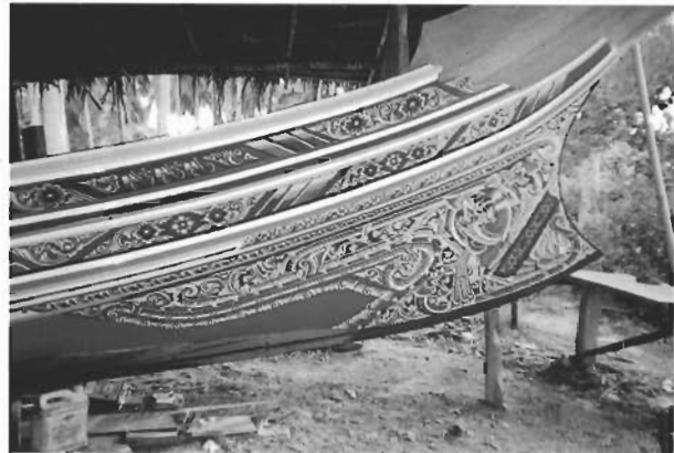
ระหว่างการตกแต่งลวดลายจิตรกรรมบนเรือกอลและ

เรือกอลและที่ช่างแวมะ และมามะ ถูกว่าจ้างให้ต่อเป็นเรือกอลและแบบดั้งเดิมที่มีหัวเรือและท้ายเรือเชิดสูงชัน ช่างทั้งสองใช้เวลา 6 เดือนในการต่อเรือกอลและลำนี้ เริ่มตั้งแต่การเตรียมไม้ ไม้ที่ใช้ในการประกอบ คือ ไม้จ๊องา หรือไม้ตะเคียนทอง โดยนำไม้มาเป็นท่อนๆ เพราะช่างไม่สามารถนำไม้ที่เป็นแผ่นสำเร็จรูปจากโรงขายไม้มาใช้ในการต่อเรือได้ เรือกอลและลำใหญ่ที่สุดนี้จึงจำเป็นต้องใช้ไม้จ๊องาที่มีความยาวเท่ากับ ความยาวของลำเรือ เพราะช่างไม่นิยมการต่อไม้ เนื่องจากจะทำให้ลำเรือไม่แข็งแรง ขึ้นตอน