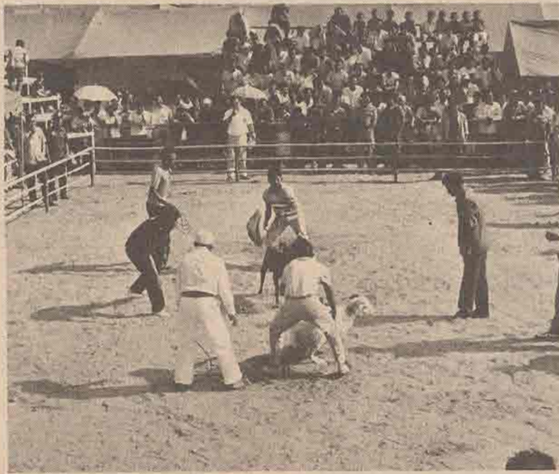
๕๘ รุสมิแล

สำหรับแกะที่เข้าชนกันเอาจริงเอาจังรู้ผลแพ้และชนะมี ๔ คู่คือ