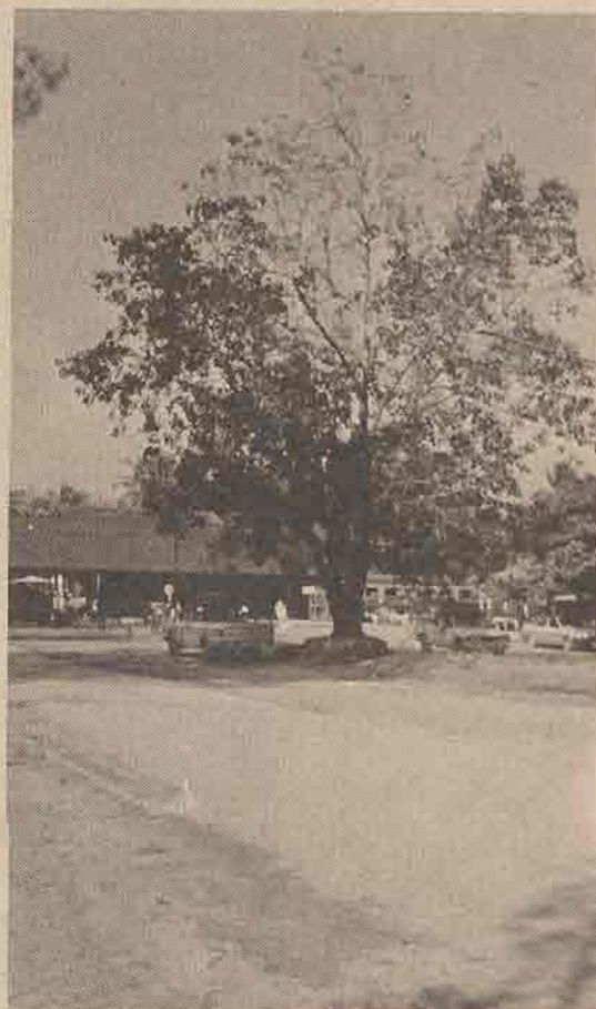
ต้นโพธิ์ที่ปลูกทดแทนขึ้นใหม่ จากต้นเก่าที่ ร.๗ ทรงปลูกไว้