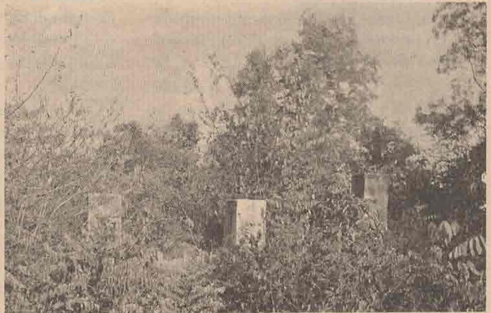
ฐานตั้งกล้องดูดาวเมื่อ ๕ พ.ศ. ๒๔๗๒ ตั้งอยู่บนเนินเขาหลังที่ว่าการ อำเภอโคกโพธิ์ปัจจุบัน ฐานซ้ายมือสุดในภาพเป็นหมุดสามเหลี่ยมใหญ่ ของกรมแผนที่ทหารบก