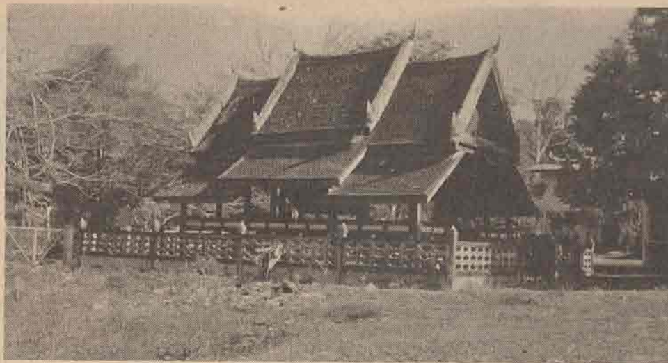
พลับพลาประดับเศด็จในหลวง ร.๗ คนในโคกโพธิ์ปัจจุบันเชื่อว่ารัชกาลที่ ๗ เสด็จมาทอดพระเนตรสุริยปราสาท เมื่อวันที่ ๕ พฤษภาคม ๒๔๗๒