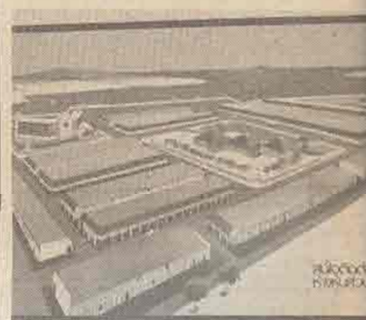
ภาพ เมืองใหม่ตาบา ในสมัยไทย สมภารมหนานคร เจ้าติ

ก่อนจะถึงที่ทำการด้านสุดถาวรตาบา เราได้แวะไปที่บริเวณที่จะสร้างเมืองใหม่ ซึ่งอยู่ริมแม่น้ำสุโหลงโก-ลก จากพื้นที่ที่เคยเป็นพรุ เป็น