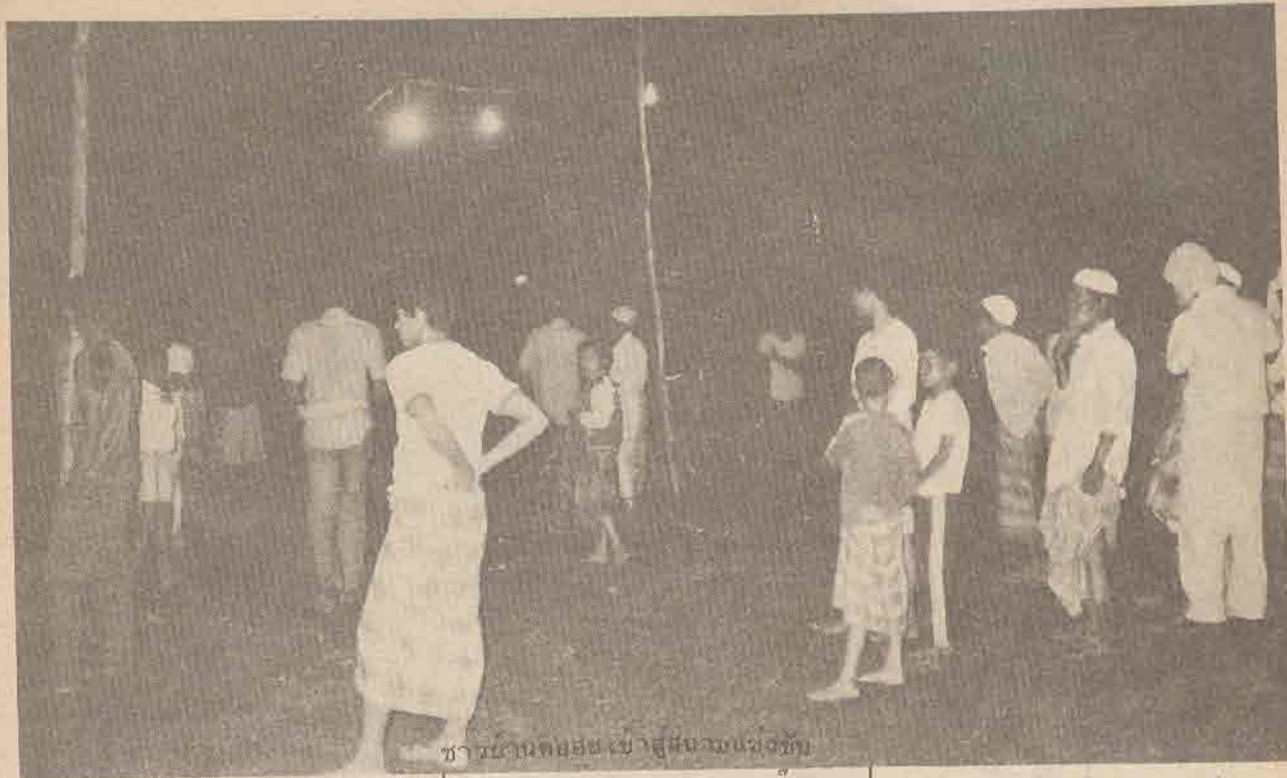
ชาวมาเลเซียเข้ามาสู่ชายแดนของไทย

นั้นเป็นสไตรคเตดดิ้งออร์แกน (ดูภาพประกอบ) ตรงส่วนนี้มีลักษณะเป็นตุ่มเล็ก ๆ (pegs) เรียงตัวกันเป็นเส้นยาว ซึ่งตึกแดนจะใช้ผูกกับขอบปีกหน้า (tegmen) ทำให้เกิดเสียงขึ้น ดังที่ชาวไทยมุสลิมฟังเสียงเป็นจือแหมะ จือแหมะ จือแหมะ จือแหมะ..... บางตัวส่งเสียงจือแหมะ ได้เกือบ 40-50 ครั้งต่อ 1 นาทีนี้แหละเป็นกติกาสัญญ์ในการแข่งขันฟังเสียงตึกแดน