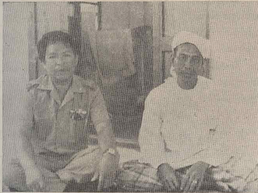
ครูใหญ่ และ โตะอิหม่าม

"ความจริงรูสมิแลก็มีที่นานะครับ แต่ทำนาไม่ได้ผลเพราะน้ำเค็มท่วมถึง ก่อนนี้เคยทำกัน ต่อมาพวกชลประทานมาชุดดิน แล้วทำไม่สำเร็จ ปล่อยทิ้งไว้ 2 ปีแล้ว ทำให้เกิดผลเสียหายคือชาวบ้านทำนาไม่ได้ ผมเคยไปตามพวกชลประทานดู เขาบอกว่าเขาเลิกโครงการเสียแล้ว เพราะไม่มีทุนพอแถมที่อื่นยังมีความจำเป็นมากกว่า ผมสงสัยว่าทำไมมาชุดดินทิ้งไว้แล้วทำให้ชานาเคือคร้อนเล่าครับ และที่เคือคร้อนมีผลคามมากคือ ฤดูแล้งเขาชาน้ำค้ำ ที่เป็นบ่อก็เค็ม จึงแก้ปัญหโดยไปขนน้ำในระยะทางไกลๆ ส่วนใหญ่ก็ไปเอาแถวมหาวิทยาลัยฯ พอประทังไปได้"