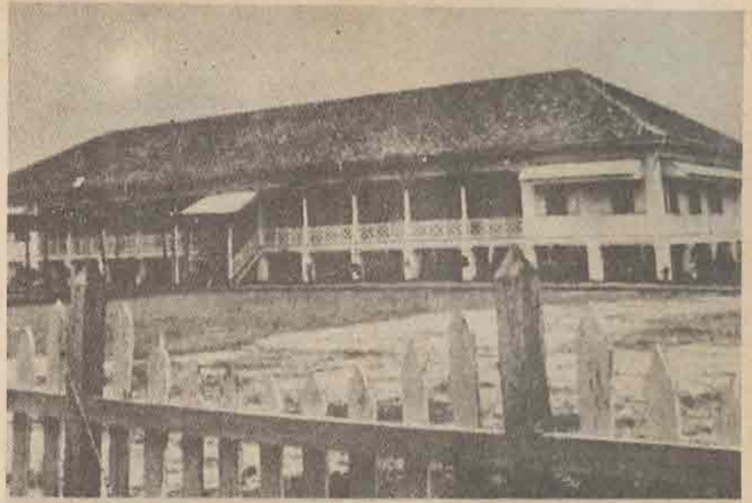
ศาลาที่วังกรมวังบาล จังหวัดปัตตานี

ตอนข้าพเจ้ากลับบ้านข้าพเจ้าได้รับคำบอกเล่าจากบุคคล ซึ่งได้เดินทางไปภูเขาบูทิดเบอซาร์กับเรา พวกเขาบอกว่าปีศาจที่ดุร้ายสิงสถิตในภูเขาแห่งนั้น คือ ฮันตูรายา (Hantu Raya) และดังซื่อ (Langsuir - Langsuch) ชาวบ้านเกาะทรายขาวบอกว่าปีศาจดังซื่อนี้จะอยู่แถบภูเขาบูทิดเบอซาร์มาก และมักจะสร้างความยุ่งยากให้กับแม่บ้านแถบนั้นที่มีนิสัยตระหนี่ โดยเฉพาะอย่างยิ่งเวลาที่แม่บ้านเหล่านั้นทำการดำข้าว มันจะทำความดีโดยมาช่วยดำข้าวให้กับผู้หญิงเหล่านั้น ขณะเดียวกันมันจะขโมยข้าวที่ดีและข้าวที่ดีที่สุด เหลือไว้แต่เม็ดกรวดไว้ในครกดำข้าว วิธีที่จะป้องกันการขโมยข้าวคือ แม่บ้านเหล่านั้นจะต้องครอบหรือปิดครกดำข้าวด้วยที่สำหรับรองหม้อข้าว ซึ่งทำด้วยเครื่องจักสาน วิธีนี้เป็นวิธีป้องกันที่มีประสิทธิภาพมากที่สุด ทั้งนี้เพราะเมื่อปีศาจมองเห็นที่รองหม้อข้าว ทำให้เกิดความขยาดกลัว คิดว่าเป็นกับดัก