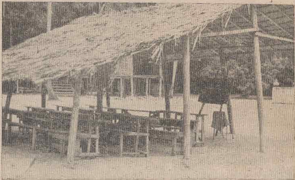
โรงเรียนในวัดมณีนิรมิต พระภิกษุใช้สำหรับสอนเด็กไทยพอให้รู้หนังสือ

แม่แต่งงานมารโรงเรียนเขาก็จำกัค หรืออาชีพขบรดแทกซ์หรือรถสามล้อ เขาก็ห้ามเพราะสงวนไว้ให้พวกเขาเอง ส่วนเรื่องกรรมสิทธิ์ที่ดินก็ยังไม่ไปกันใหญ่ เขาซื้อที่ดินของเราได้ แต่เราซื้อของเขาไม่ได้ พวกคุณก็ตกๆแต่ละครั้งแล้วเราจะก้าวหน้าได้อย่างไร