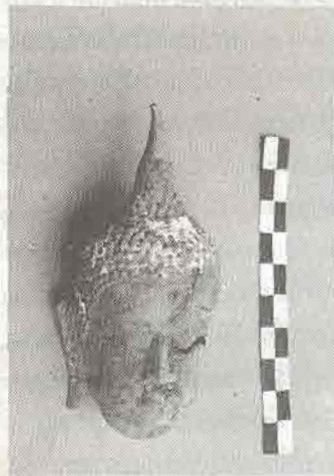
เศียรพระพุทธรูป

๒. เศียรพระพุทธรูปปูน ปั้น พบตั้งแต่ส่วนพระคอขึ้นไปจนถึง อุษณิษะ ยาว ๒๗ ซม. แกนในทำ ด้วยปะการัง (หินหอย) เป็นโกศนรูป เศียรแล้วใช้ปูนปั้นตกแต่งลวดลาย ในส่วนรายละเอียดของพระพักตร์ ด้านหลังตัดแบนเรียบ ด้านข้างเหมือน พระกรรมทำปูนปั้นคล้ายกับเป็น กรรเจี๊ยก ของพระพุทธรูปทรงเครื่อง ที่นิยมกันในสมัยอยุธยาตอนปลาย (ราว พศว.ที่ ๒๑-๒๓) พบบริเวณ ตรงกับส่วนซุ้มหลอกขององค์เจดีย์ ด้านทิศเหนือ เข้าใจว่าเป็นพระพุทธรูปปูนปั้นแบบนูนสูง ที่ประดิษฐาน ในซุ้มหลอกดังกล่าว