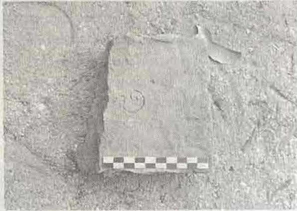
แผ่นอิฐสลักอักษร

บริเวณติดกับองค์เจดีย์ หรือด้านล่าง องค์เจดีย์ โดยจะใช้ประโยชน์ในการ บรรจุกระดูก (ที่เผาไฟแล้ว) อยู่ใน การฝังภาชนะดินเผาดัง กล่าวว่ามีหลายรูปแบบ อาทิ การใช้ อิฐก่อล้อมรอบตลอดจนถึงด้านบน และด้านล่าง แล้วใส่ภาชนะดินเผา ไว้ข้างใน บางชิ้นจะเรียงอิฐเฉพาะ ทางด้านข้าง, บางชิ้นก็ฝังอยู่ในดิน โดยไม่มีอิฐก่อล้อม นอกจากนั้นทาง มุมด้านทิศตะวันตกเฉียงเหนือพบ กลุ่มภาชนะจำนวนมากหนึ่งที่คล้ายกับ เป็นการขุดหลุมแล้วเทภาชนะดิน เผาใส่ไว้ภายใน ภาชนะเหล่านี้จึงอยู่ ในสภาพที่ไม่เป็นระเบียบ เป็นต้น ภาชนะดินเผาดังกล่าวทั้งหมด มี ลักษณะพิเศษคือ มีการเจาะรูบริเวณ ก้นภาชนะด้วย ส่วนใหญ่เจาะเพียง รูเดียว แต่บางชิ้นเจาะถึง ๓ รู ยังไม่ สามารถทราบได้ชัดเจนว่า ความ เชื่อในการเจาะรูด้านล่างนี้มีมาตั้ง แต่สมัยใด และเป็นความเชื่อถือใน รูปแบบใด