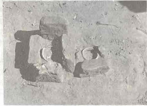
ภาชนะดินเผา

ภาชนะดินเผาที่พบมีหลาย รูปแบบ ทั้งภาชนะแบบเคลือบ และ แบบพื้นเมือง(เนื้อดิน) ที่มีการตกแต่ง