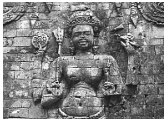
ภาพพระลักษมี 4 กร ที่ปราสาทกระวัล กัมพูชา

นอกจากนั้น จารึกที่ปราสาทชนะ ในรัชกาลของพระเจ้าอุทัยทิตยวรมัน ที่ 2 (พ.ศ.1593-1609) ได้กล่าวถึงรูปพระลักษมีทองคำ ซึ่งพระองค์ได้ พระราชทานแก่ข้าราชการบริพารท่านหนึ่ง เพื่อเป็นเครื่องหมายของหน้าที่ใน การเชิญพัตโปก (สุภัทรดิศ ดิศกุล, 2547, 57-58)