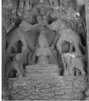
ภาพคชลักษมี ถ้ำเอลโลรา ประเทศอินเดีย อายุราวคริสต์ศตวรรษที่ 8 ก่อนคริสตกาล