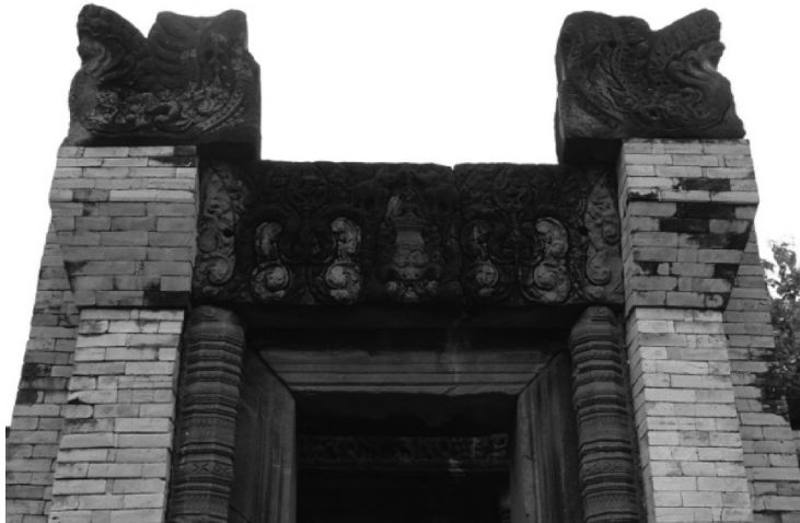
คชลักษณ์ ทับหลังเหนือกรอบประตูชั้นนอก

ที่ปราสาทสระกำแพงใหญ่นี้ ปรากฏภาพคชลักษณ์ ที่บรรณาลัยด้านทิศใต้ คือบริเวณทับหลังเหนือกรอบประตูชั้นนอก สลักเป็นรูปคชลักษณ์ อยู่เหนือหน้ากาล ขนาบข้างโดยช้างสองเชือก ชูวงงเข้าหากันอยู่เหนือชุ้ม มีเทวดาร่ายรำอยู่ทั้งสองข้าง จัดอยู่ในศิลปะเขมรแบบบาปวนตอนต้น