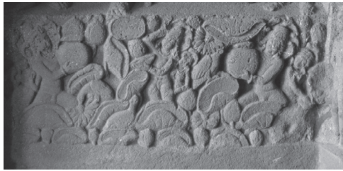
ภาพสระบัว มีบุคคลถือหม้อน้ำปรากฏด้านซ้ายและขวา ใต้ภาพศรีเทพ จากถ้ำเอลโลรา

2.2 ดอกบัว พระวิษณุกล่าวไว้ใน ภควัดคีตาว่า “จงมีชีวิตอยู่เหมือนดอกบัว ที่แม้กำเนิดจากน้ำ แต่น้ำก็ไม่สามารถสัมผัสดอกบัวได้” นอกจากนั้นความหมายของดอกบัวนั้นสัมพันธ์กับคำว่า ศรี-ลักษมี หมายถึง ความบริสุทธิ์และพลังกำลัง รากของดอกบัวแม้จะจมอยู่ในโคลนตม แต่สามารถขึ้นมาบนเหนือน้ำได้ โดยโคลนไม่สามารถให้มีรอยมลทินได้ ดอกบัวแสดงถึงจิตใจที่ต้งามและพลังอำนาจ