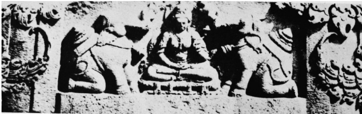
ภาพทับหลัง ศาสนสถานที่จันทินาคาสำหรับ (สุภัทรรติศ ดิศกุล, 2518, รูปที่ 56)

จะเห็นว่าลักษณะประติมากรรมคชลักษณ์ที่มีลักษณะพิเศษ แตกต่างจากที่อื่นคือ ช้าง แสดงอาการหมอบแตกต่างจากที่อื่นคือ ก้มพุง และไทย ทั้งยังแบกบางสิ่งไว้บนหลังอีกด้วย ซึ่งอาจเป็นดอกบัว ภาพที่สลักก็เรียบง่าย ไม่มีรายละเอียดมากเท่าใดนัก แต่ยังคงสัญลักษณ์ของคชลักษณ์คือ ดอกบัว ช้าง และหม้อน้ำ