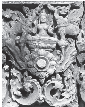
ภาพคชลักษณ์ที่ปราสาทแม่บุญตะวันออก

ลักษณะของพระลักษมีที่ปรากฏนั้น ประทับนั่งขัดสมาธิบนบัณฑาสนะ มี 2 กร ถือดอกบัวทั้งสองกร พระนางสวมมงกุฏ แต่งกายเครื่องทรงแบบ กษัตริย์ ศิลปะแบบแปรรูป ขนาบข้างด้วยข้างสองเชือก แต่งเครื่องทรงด้วย เช่นกัน ยืนบนดอกบัวที่ผุดมาจากเบ้องล่าง ชูงวงที่รัดหม้อน้ำไว้ แสดงอาการ สรงพระนาง ที่น่าสังเกตคือ ลักษณะของหม้อแตกต่างจากภาพประติมากรรม แห่งอื่น ๆ ไม่ว่าจะเป็นที่อินเดีย หรือประเทศไทย ซึ่งจะเป็นลักษณะหม้อ ก้นกลม แต่ที่ปราสาทแม่บุญตะวันออกนี้ ลักษณะของหม้อมีฝาจุกลาย แผลม และมีพวยกาด้วย ซึ่งเป็นลักษณะที่ไม่เคยพบที่ไหนมาก่อน และ น่าจะเป็นลักษณะพิเศษเฉพาะที่ประเทศกัมพูชา