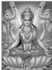
ภาพคชลักษมี 4 กร