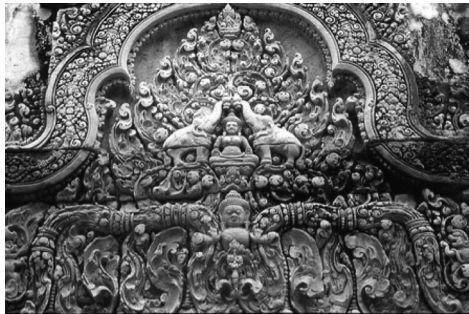
ภาพขลักษ์มีที่หน้าบัน ปราสาทบันทายศรี

การแต่งกายของพระลักษมี ปรากฏเพียงสวมกระบังหน้า และนุ่งเครื่องทรงอย่างศิลปะบาปวน เนื่องจากปราสาทนี้สร้างขึ้นราวพุทธศตวรรษที่ 15 จัดอยู่ในสมัยบาปวน