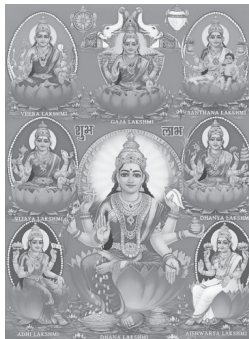
ธนลักษมี/ไอศวรรยลักษมี