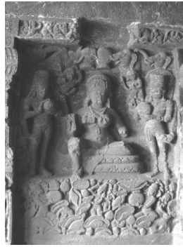
ภาพพระศรีลักษมี ถ้ำเอลโลรา ประเทศอินเดีย

ใน ศิลปรัตน์ะ กล่าวว่านางมีกายสีขาว และกล่าวยิ่งไปกว่านั้นว่า นางถือดอกบัวในมือซ้ายและมือขวาถือผลมะตูม นางสวมสร้อยมุกและขนาบข้างโดยสองสาวพรหมจรรย์ผู้ซึ่งสบัดพัดขนจามรีไกล่ๆ นางมักถูกรดน้ำจากหม้อสองใบ